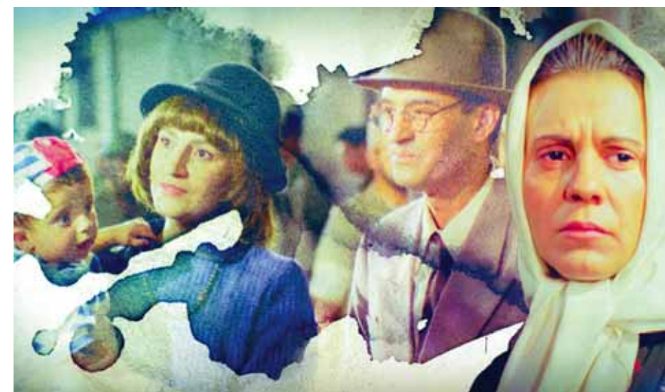
من فيلم «التبقي»

مصعب أيوب | انطلقت سورية من إيمانها بالقضايا العربية وسعت بشكل دائم إلى أسنسة القضايا والوقوف إلى جانب إخوتها العرب ومساندتهم ومناصرتهم، ولأسيميا في مواجهة الاحتلال والظلم والإرهاب، فعملت السينما السورية منذ بداية انطلاقها على تجسيد وتكريس انتمائها هذا عن طريق الإنتاجات السينمائية العديدة التي رصدت واقع ومرارة المعاناة الفلسطينية وضكت التهجير والتشرد، وقد تصدى الكثير من الأعمال السينمائية لنقل هموم ومعاناة الفلسطينيين وحمل على عاتقه مهمة نقل الأمهه للخراب وتعريف الجميع بما يعيشونه في ظل التهجير القسري والنزوح الدائم وقلة المواد الأولية والقمع والإرهاب والممارسات اللاإنسانية التي لا يمل ولا يكل العدو الغاشم من فرضها وهو الذي احتل الأرض واستباح الممتلكات على غير وجه حق.