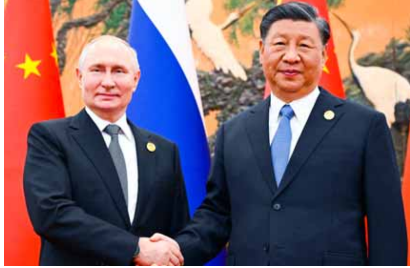
الرئيس الصيني خلال استقباله الرئيس الروسي في افتتاح منتدى «الحزام والطريق»

للشريحة عبر جهودنا المشتركة. وتوقع الرئيس الصيني أن يتجاوز حجم التجارة الخارجية للصين في السلع والخدمات 32 تريليون دولار خلال السنوات الخمس القادمة، لافتاً إلى أن بلاده أصبحت شريكاً تجارياً رئيسياً لأكثر من 140 دولة ومنطقة، وأضحت أيضاً مصدراً رئيسياً لاستثمار لعدد متزايد من الدول. بدوره أكد الرئيس الروسي فلاديمير بوتين أن روسيا والصين تستعيان بشكل مشترك لتطوير المنتجات والرخاء الاجتماعي، وتتمسكان بالتعاون المتكافئ واحترام حق الدول في انتهاج طريقها الخاص بالتنمية، ونقل موقع «روسيا اليوم» عن بوتين قوله في كلمة أمام المنتدى المنعقد في العاصمة الصينية بكين: إن مبادرة الحزام والطريق التي قدمتها الصين سيكون لها دور في حل المشكلات الإقليمية والدولية المالية، لافتاً إلى أن موسكو وبكين تعلمان بجهد من أجل تحقيق التقدم الاقتصادي والرفاه الاجتماعي على المدى الطويل. وأضاف بوتين: كل واحد منا عند بدء عمل تجاري كبير ياطبع يتوقع أن يكون ناجحاً، ولكن مع هذه الأبعاد العالمية التي بناها الرئيس الصيني قبل عشر سنوات بصراحة كان من الصعب توقع أن كل شيء سينجح، لكن أصدقاءنا الصينيين يحرصون نتائجنا بالفعل، ونحن سعداء جداً بهذه النجاحات، لأنها تهم الكثيرين منا. وأشار بوتين إلى الخطط الرئيسية طويلة الأجل التي بدأت بالفعل في التنفيذ العملي، والتي تكمل العديد من مشاريع البنية التحتية في أوراسيا، مؤكداً أنها معاً يجعلان من الممكن إنشاء أطر واحد للنقل والخدمات اللوجستية.