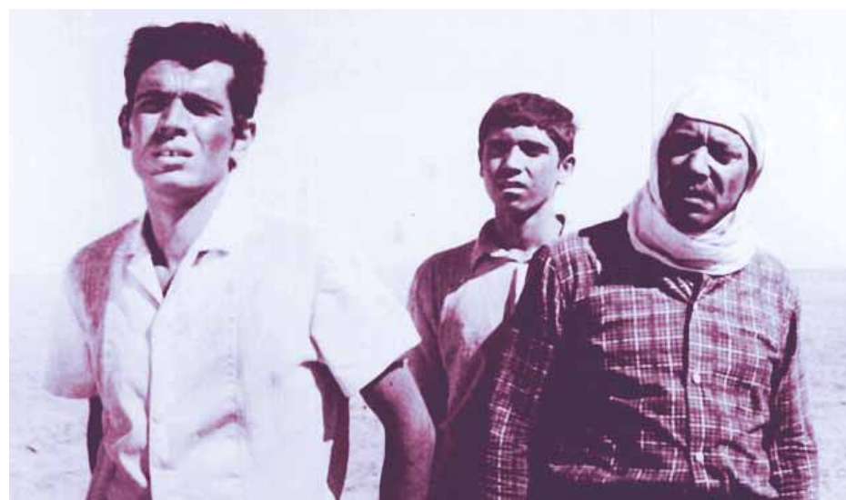
من فيلم «المخدوعون»

كفر قاسم أهم شاهد فني على جرائم الاحتلال