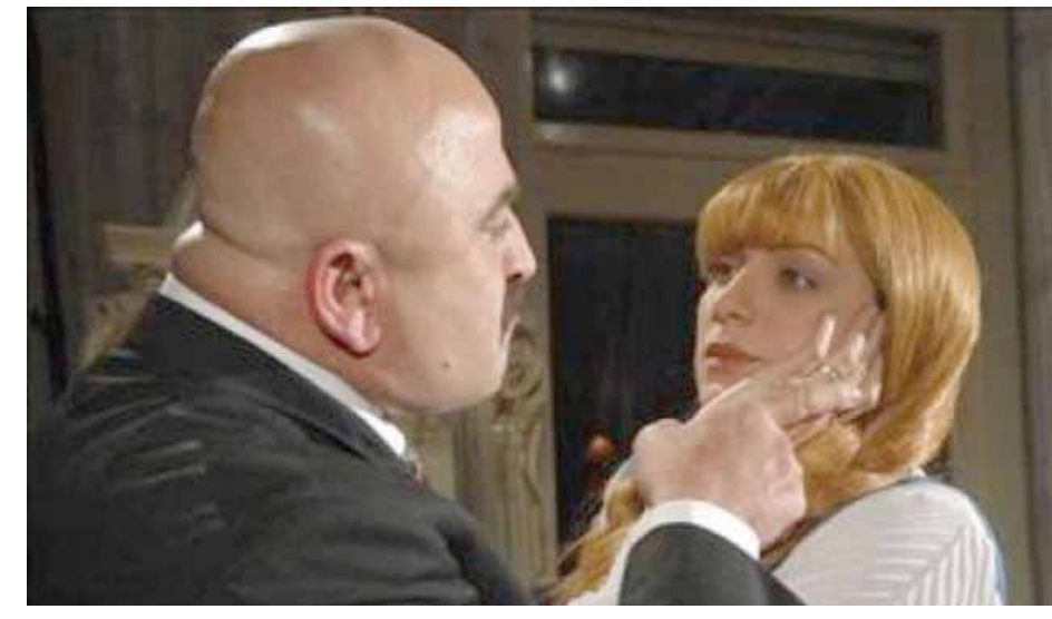
من مسلسل «رسائل الحب والحرب»

على ما تخلفه الأحداث والحروب والأحداث المريرة على الصعيد الإنساني، فيبرهن العمل على ضرورة العدل والاستمرار في مسألة السلام والحب. فنصير العمل حوادث حصار مدينتي رام الله وجنين، وركز على أهمية التلاحم الديني في كثير من مشاهدته ولعل أبرزها صلاة المسلمين في كنيسة المهدي، إضافة إلى أنه قدم صوراً عديدة للإنسان العربي المتضامن والمتسامح الساعي للخير. وقد أدى أنوار البطولة في العمل عدد من نجوم العرب ومنهم عباس النوري وحسن عويتي وديمة قندلفت والأرنبونيون منظر رياحته وصيا مبارك وإياد نصار وأخرجه التونسي شوقي الماجري.