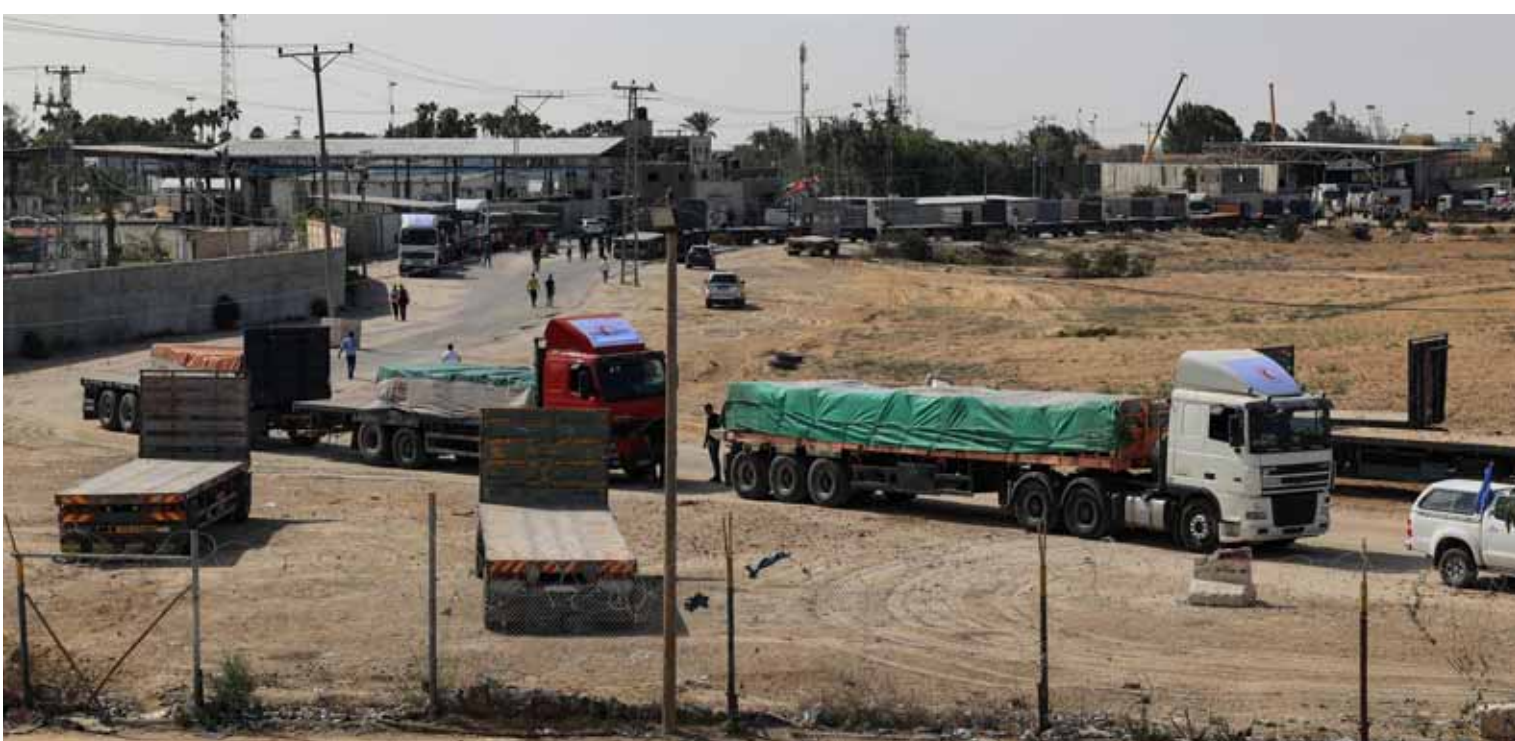
مساعدات إنسانية رمزية تدخل قطاع غزة

وتزامناً مع المحطات الميدانية خرجت «قمة السلام» التي عقبت في القاهرة أمس وحضرها مسؤولون من أكثر من