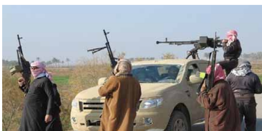
مقاتلوا العشائر العربية يشنون هجوماً على «قسد»

الموح في البلدة الواقعة في ريف دير الزور الشرقي. وبيّن المصادر أن مقاتلي العشائر دكوا أمس حواجز ونقاط عسكرية لـ«قسد» بقذائف الهاون في بلدتي حواجب وعرائج شرق دير الزور، واشتبكوا معهم بالرشاشات الثقيلة، ما اضطرهم إلى طلب النجدة التي وصلتهم عن طريق رتل عسكري قدم من شمال المحافظة.