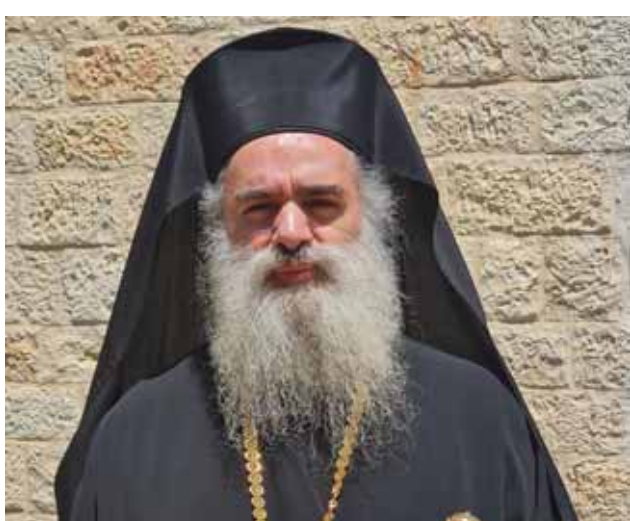
رئيس أساقفة سبسية للروم الأرثوذكس المطران على الله حنا

وكرر مناشدته لكل المرجعيات الروحية والحقوقية والإنسانية، بضرورة التحرك نصرة للشعب الفلسطيني المظلوم، وتوجه بالتحية إلى أحرار العالم الذين يتظاهرون في كل مكان وفي كل العواصم والأقطار رفضاً للعدوان وتضامناً مع الشعب الفلسطيني المظلوم.