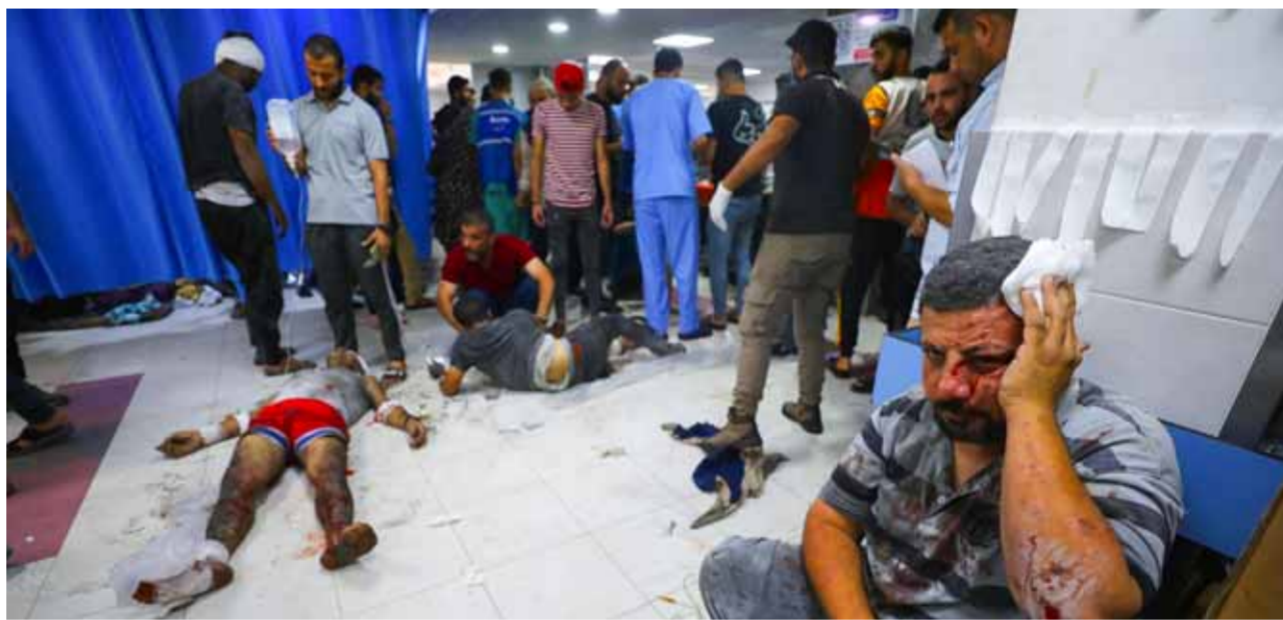
شهداء وجرحى في مستشفى الشفاء في غزة نتيجة استمرار العدوان الإسرائيلي

أظهرت أن المجلس الأوروبي يؤيد دعوة الأمين العام للأمم المتحدة أنطونيو غوتيريش إلى هدنة إنسانية من أجل السماح بوصول المساعدات الإنسانية بشكل آمن، ووصول المساعدات إلى المحتاجين. وجاء في المسودة: سيعمل الاتحاد الأوروبي بشكل وثيق مع الشركاء في المنطقة لحماية المدنيين، ودعم من يحاولون الوصول لير الأمان أو تقديم المساعدة الطبية والوقود والمأوى. على صعيد آخر دعا المتحدث باسم السفارة الصينية في واشنطن ليو بينغوي إلى وضع حد للمبالغة التي لا أساس لها، بشأن نشر السفن الحربية الصينية في الشرق الأوسط، بالتزامن مع استمرار العدوان الإسرائيلي على غزة.