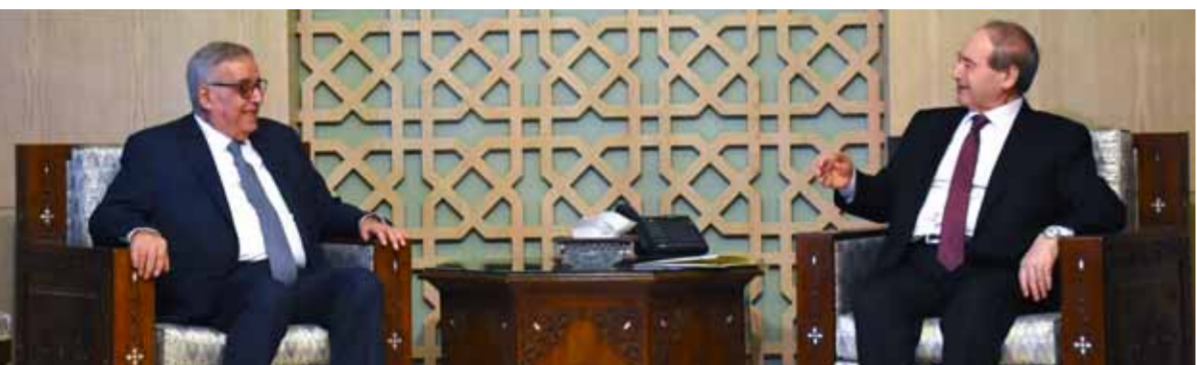
وزير الخارجية والمغتربين فيصل المقداد خلال استقباله نظيره اللبناني عبد الله بوجيب

وشرح المقدمات الإجراءات التي اتخذتها سورية على مدى السنوات الماضية وفي الأونة الأخيرة إعادة الأمن والاستقرار وتيسير عودة المهجرين إلى وطنهم، مؤكداً أن سورية ترحب بجميع أبنائها وتلتزم بعودتهم، وتبذل قصارى جهدها بالتعاون مع الدول الصديقة والشركاء في العمل الإنساني لتحقيق ذلك. من جهته أعرب وزير الخارجية اللبناني عن امتنانه وتقديره للجهود والإجراءات التي اتخذتها سورية، وتم الاتفاق على عقد اجتماعات تنسيقية لاحقة على مستوى المسؤولين والخبراء المختصين لمتابعة المسائل المتعلقة بعودة اللاجئين، وضبط الحدود، وتبادل تسليم المحكومين العلبين، وغيرها من المسائل ذات الاهتمام المشترك.