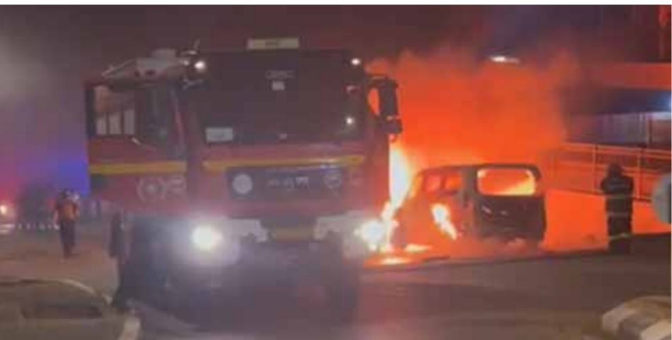
المقاومة اللبنانية تقصف مستعمرة «كريات شمونة» بعد من صواريخ غراد «كاتيوشا» (عن الإنترنت)

وأضافت المقاومة في بيان آخر: إن مجاهدتها استهدفوا كتحة «أفيغيم» وموقع «جل الدين» بالصواريخ الموجهة والأسلحة المناسية. بمزاورة ذلك، نقل موقع «العهد» الإلكتروني اللبناني عن وسائل إعلام الاحتلال الإسرائيلي، تأكيدها سقوط إصابات جراء استهداف حزب الله بالصواريخ الموجهة آية في مستوطنة «بفتح». وترامن ذلك مع إعلان المقاومة الإسلامية اللبنانية التي تحدثت فيه عن استهداف مجاهدتها آية عسكرية تابعة لجيش الاحتلال الإسرائيلي في موقع «بياض بلديا» بالصواريخ الموجهة، وأسفر الاستهداف عن وقوع طائفة بين قتيل وجريح.