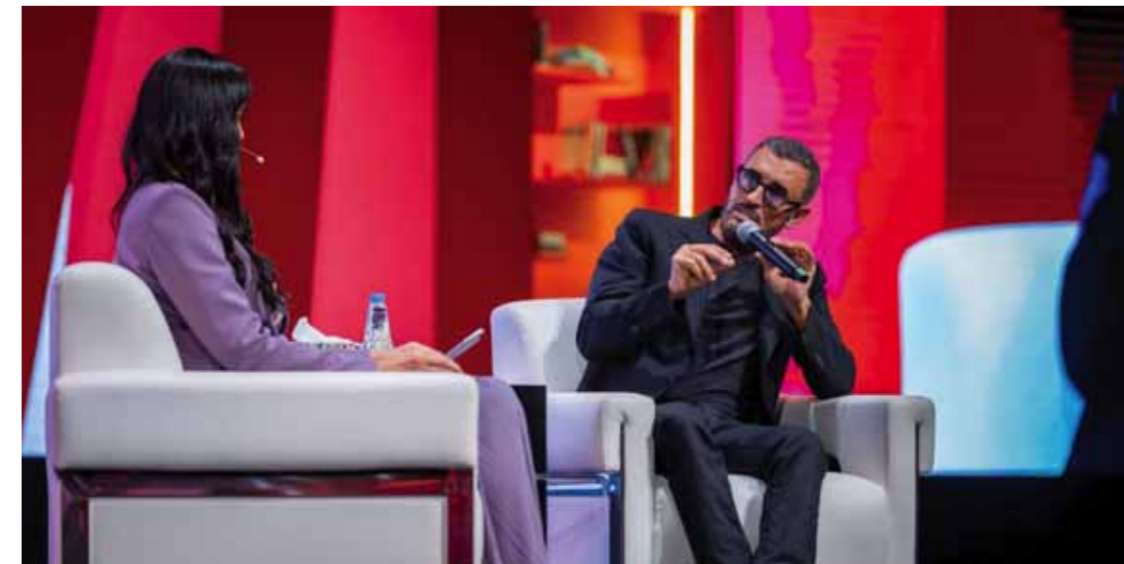
الشارقة - الوطن

تحدث عن مسيرته الفنية وعن علاقته بالشعر والأدب