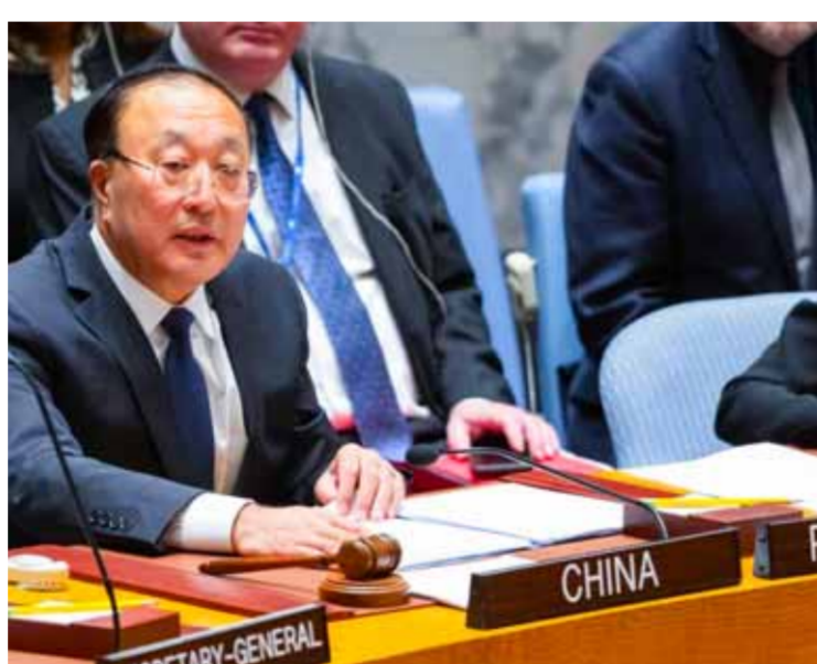
تشانغ جون الممثل الدائم للصين لدى الأمم المتحدة

كنك أعلن أن عمال الإغاثة التابعين للأمم المتحدة الذين لقوا حتفهم منذ بدء الحرب في قطاع غزة في تصاعد، وهو أكثر من أي وقت آخر في تاريخ المنظمة العالمية. في غضون ذلك أكد قائد الثورة في الجمهورية الإسلامية في إيران علي خامنئي خلال لقائه رئيس الوزراء العراقي، محمد شياع السوداني، أن الأميركيين شركاء بجرمان الاحتلال الإسرائيلي في العدوان على غزة. واعتبر خامنئي أنه يتوجب على العالم الإسلامي زيادة الضغط السياسي على الولايات المتحدة والكيان المحتل لوقف الجرائم بحق الشعب الفلسطيني في غزة.