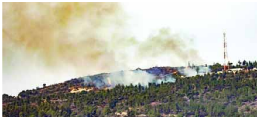
من عمليات استهداف حزب الله لواقع الإحتلال الإسرائيلي على طول الحدود اللبنانية مع فلسطين المحتلة

المستوطنين الموجودين في مستوطنات الشمال الدخول إلى الملاجئ. وقالت «نجمة داوود»: إنها قدمت إسعافات لـ10 أشخاص أصابوا بجروح مختلفة من جراء إطلاق قنائف ومجموع حربي تابعة لقوات الإحتلال في المنطقة الشمالية، إصابة 23 إسرائيليًا في المنطقة الشمالية، نتيجة الهجمات التي انطلقت من لبنان. وسائل الإعلام الإسرائيلية وصفت ما جرى أمس بأنه اليوم الأكثر اشتعالاً منذ بداية المعركة في الشمال، معلية أن «حزب الله ضرب عرض الحائط تحذيرات وزير الأمن، يواف غالاتن»، وقالت: إن حزب الله تجاوز منذ مدة «الخط الأحمر الذي تحدثت عنه غالاتن»، مضيفاً: إن «هجمات حزب الله تعد وصمة مباشرة». كما استهدف المقاومون جرافة تابعة للاحتلال، قرب