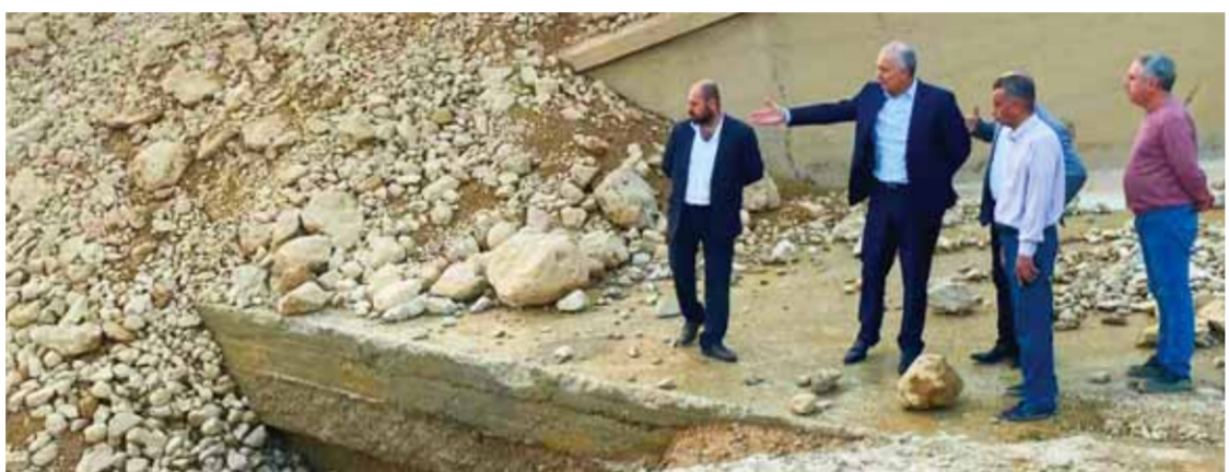
فادي بك الشريف

تفقد وزير النقل زهير خزيم، أمس مواقع الانهيارات والسيول الجارفة على عدة مواقع في منطقة الثنايا على أوتوستراد حمص الثنايا دمشق نزول جسر بغداد بالاتجاهين والذي تعرض لانهيار جبلي نتيجة الأمطار الغزيرة. وأشاد الوزير بجهود فرق العمل التي استغرقت منذ ساعات الليل وواصلت عملياً لإعادة الطريق لوضعه الطبيعي وإزالة الأنقاض والأتربة والحوادث التي جرفتها الأمطار وتكاتف وحدات العمل مع جهود نوعية كبيرة من محافظة ريف دمشق والمجتمع الأهلي والشرطة وفرع المرور والدفاع المدني والإطفاء، التي عملت على تنظيف الأوتوستراد من كامل الصخور والأتربة التي وصل ارتفاعها إلى ٢ م وهو الآن سالك وأمن لكل السيارات المارة. هذا وكلف الوزير المؤسسة العامة للمواصلات الطرقية معالجة المواقع وإعادتها وفق معايير السلامة والأمان والجودة الفنية المعتمدة بالسرعة الممكنة، علماً أن الانهيار وقع في تمام الساعة ١٢ ليلاً وعلى الفور توجهت آليات وكوادر محافظة ريف دمشق، والمؤسسة العامة للمواصلات الطرقية، والشرطة والدفاع المدني والإطفاء بمساعدة المجالس المحلية المجاورة ومساهمة للمجتمع المحلي، إذ حضرت ١٠ تراكسات و١٠ سيارات كبيرة من جهة نكر مدير عام مؤسسة المواصلات