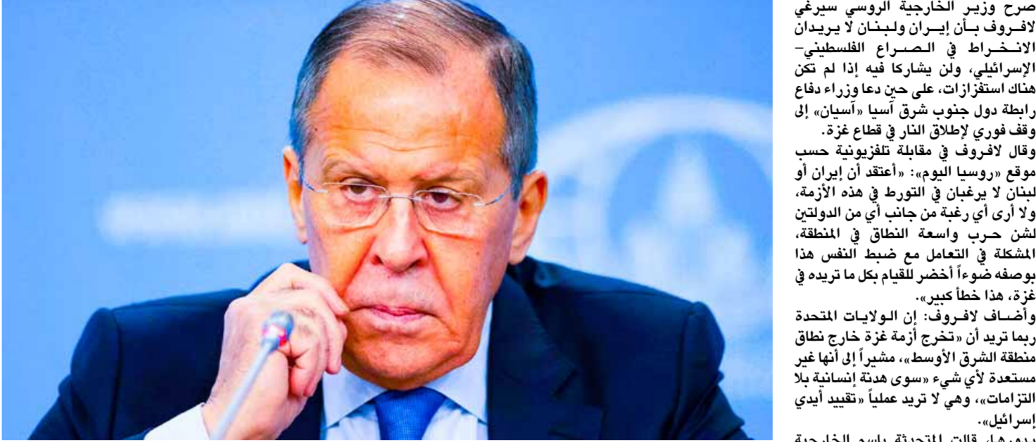
وزير الخارجية الروسي سيرغي لاروف

البيليزية قولها في بيان أمس: «لم تستجب إسرائيل أخلايقنا المتحررة بوقف فوري لإطلاق النار، ورفضت عمل اللجنة الدولية في التفاوض مع وزير دفاع روسيا اليوم»، «أعتقد أن إيران أو لبنان لا يرغبان في هذه الأزمة، ولا أرى أي رغبة من جانب أي من الدولتين المنتهجة في التنازع مع ضبط النفس هذا بوصفه ضوياً أخضر للقيام بما تريد». وعرضاً عن الدول في التفاصيل العملاقة لهذا السنياروي، لا بد من تفسيره على أنه يأتي في إطار الإجراءات والتحركات العسكرية الأميركية والأطلسية الراكفة ويهدف ضمن استراتيجية الناتو، المعتمدة كخدمة السياسة العامة للإمبريالية الأميركية والصهيونية العالمية والإسرائيلية التوحشية. ولعل ما يحصل الآن من أحداث إرهابية وعسكرية في العديد من الأرجاء الدولية والإقليمية والعربية، إنما يتدرج في خدمة تلك الاستراتيجية العسكرية والإقليمية الشمالية في فلسطين المحتلة لدى الكيان الصهيوني الأمريكي، وتعلّق ارتباطها على إسرائيل كاحتياجها على عنوانه الوحشي المستمر على غزة.