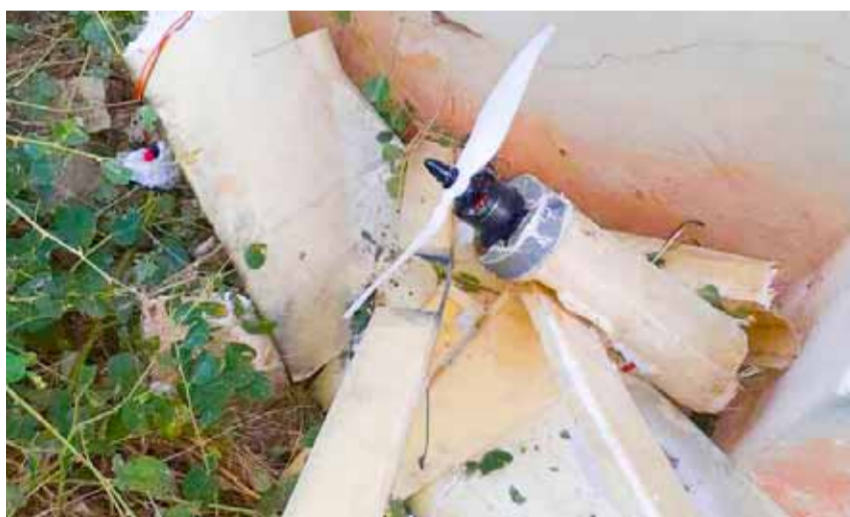
حطام إحدى الطائرات المسيّرة التي أسقطها الجيش السوري للإرهابيين على محور حلب اللاذقية