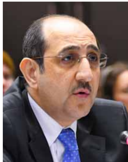
نائب وزير الخارجية الروسي ميخائيل بوغدانوف ونظيره السوري هاشم صباغ