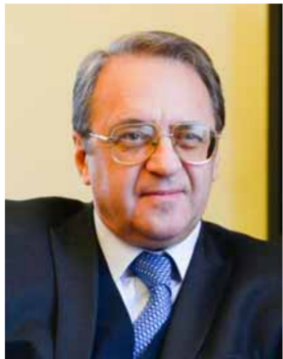
نائب وزير الخارجية الروسي ميخائيل بوغدانوف ونظيره السوري هاشم صباغ (عن الانترنت)

منطقة الصراع الفلسطيني الإسرائيلي، وتم التأكيد على ضرورة بذل جهود متعددة الأطراف تهدف إلى تحقيق سلام دائم وشامل في الشرق الأوسط على أساس القانون الدولي». كما «جرت مناقشة معمقة مبنية على الثقة المتبادلة حول الوضع المستجدي في سورية وما حولها، وفي الوقت نفسه تم إيلاء الاهتمام لمهمة تعزيز التسوية السياسية الشاملة في سورية، مع التقيد الصارم بمبادئ احترام سيادة ووحدة وسلامة أراضي هذا البلد الصديق لروسيا».