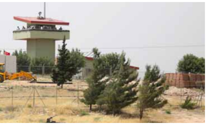
نقطة مراقبة لجيش الاحتلال التركي في ريف إدلب

تزايد عدد الهجمات العسكرية من قبل مسلحين مجهولين ضد القواعد العسكرية ونقاط المراقبة التركية غير الشرعية في إدلب في الآونة الأخيرة، على خلفية تنامي مشاعر الكره والسخط في نفوس السكان المحليين الراغبين للوجود العسكري التركي في المحافظة. وسجل الشهر الجاري 4 هجمات ضد الوجود العسكري للاحتلال التركي في إدلب في سابقة هي الأولى من نوعها، خلفت قتلى وجرحى في صفوف جنود الاحتلال، ودفعته إلى اتخاذ إجراءات احترازية وتكثيف مراقبة وحماية نقاطه وقواعده العسكرية من قبل الميليشيات التابعة لإدارة أردوغان في المحافظة، وفي منطقة «خضض التصعيد» بشكل عام خشية تكرار الاستهدافات. مصادر محلية في جبل الزاوية بريف إدلب الجنوبي ذكرت أن مسلحين مجهولين تلقىهم دراجة نارية أطلقوا فجر أمس قذائف «إر بي جي» باتجاه القاعدة العسكرية لجيش الاحتلال التركي في بلدة بلو، وهو الاستهداف الثاني للقاعدة ذاتها منذ 3 أيار الماضي وبالطريقة ذاتها. وأكدت المصادر لـ«الوطن» أن إحدى القذائف سقطت داخل القاعدة التركية وحقققت إصابة مباشرة في أحد المباني الذي يواي الجنود الأتراك، ورجحت سقوط قتلى وجرحى في صفوفهم، بقتلهم سيارات الإسعاف التي هرعت إلى المكان، إلى أحد المشافي الميدانية القريبة. المصادر أوضحت أن مسلحين مجهولين على دراجة نارية أيضاً، شووا في ال 3 من الشهر الجاري هجوماً بقذائف الهاون على نقطة المراقبة لجيش الاحتلال التركي قرب بلدة الرويجة شرق جبل الزاوية، تبته اشتباكات بين