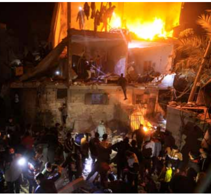
مجزرة جديدة للاحتلال الإسرائيلي في مدينة رفح

مع دخول حرب الإبادة الجماعية التي يشنها ضد قطاع غزة شهرها الثالث، ارتكب العدو الإسرائيلي مجزرة في مخيم جباليا أسفرت عن سقوط 150 شهيداً، بالترزامن مع سقوط عشرات الشهداء في مناطق مختلفة من القطاع. وسائل إعدام فلسطينية ذكرت أن الاحتلال ارتكب مجزرة فجر أمس بقتل طيرانه مريماً سكينياً في مخيم جباليا شمال القطاع، ما أدى إلى استشهاد أكثر من 150 فلسطينياً وإصابة العشرات، كما قصف مدرستين تؤولان نارحين، إحداهما غرب جباليا والثانية في خان يونس جنوب القطاع، إضافة لمنازل بمناطق متفرقة في خان يونس ومخيم النصيرات وسط القطاع وأحياء البروم والصحابة والنفق بمدينة غزة، ما أدى إلى استشهاد وإصابة العشرات. بالترزامن قصفت مدفعية الاحتلال أجزاء التفاح والدرج والشجاعية في مدينة غزة، فيما قامت جرافاته بعمليات تجريف واسعة في بلدات بني سبيلا وعبسان والقرارة جنوب القطاع. كما واصل الاحتلال حربه على المستشفيات، وأخرج جميع مستشفيات شمال القطاع من الخدمة، وأعلنت وزارة الصحة الفلسطينية ليلته الأربعة خروج مستشفى كمال عدوان الذي تخاصره قوات الاحتلال من الخدمة وقالت: جيش الاحتلال الإسرائيلي المتوغل في شمال القطاع يخرج بالقوة والإرهاب وبفوهات الدبابات مستشفى كمال عدوان الوحيد المتبقي في الشمال من الخدمة. إلى ذلك قالت وكالة غوث وتشغيل اللاجئين الفلسطينيين «أونروا»: إن موجة أخرى من النزوح تجري في غزة والوضع يزداد سوءاً كل دقيقة، مضيفاً: إن «قطاع غزة يأكله أصبح