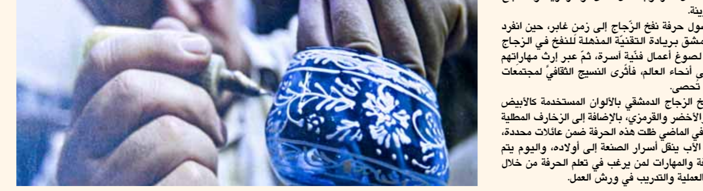
التشكيله بالشكل المرغوب، مثل كأس أو مزهرية أو مصباح أو قطعة زينة.