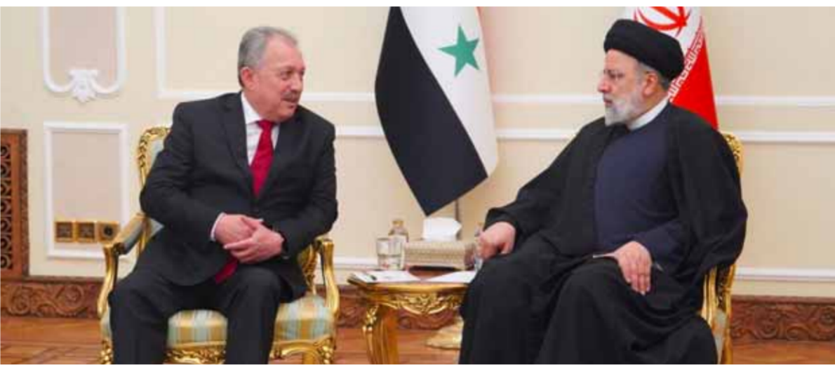
رئيس مجلس الوزراء حسين عرنوس خلال لقائه الرئيس الإيراني إبراهيم رئيسي (عن الانترنت)

وسبل تطويرها، وخاصة في المجالات الاقتصادية والتجارية. وأشار قاليباف إلى أهمية الاتفاقيات التي تم التوصل إليها خلال زيارة الوفد الحكومي السوري، وقال: «يجب الاستفادة من الفرص لتعزيز التعاون الاقتصادي والتجاري».