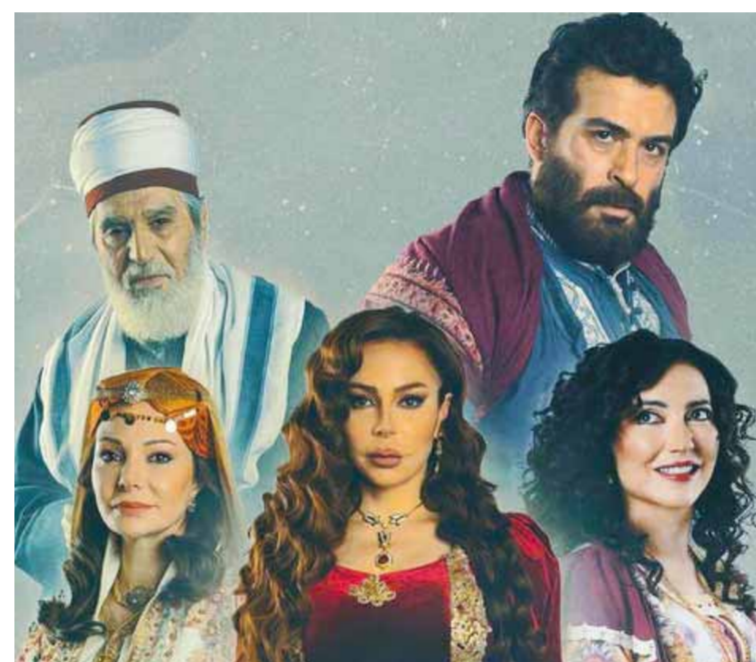
من مسلسل «مربى الجن»