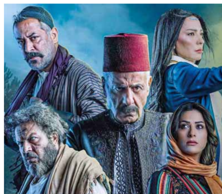
من مسلسل «زق الجن»