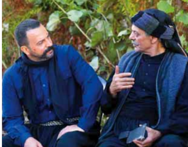
من مسلسل «الزئد»