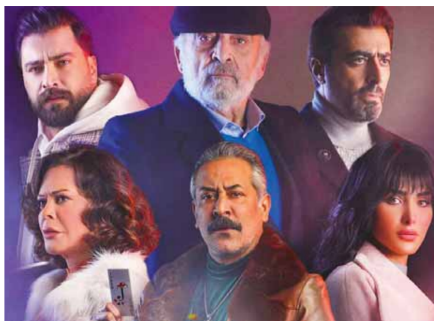
من مسلسل «خريف عمر»