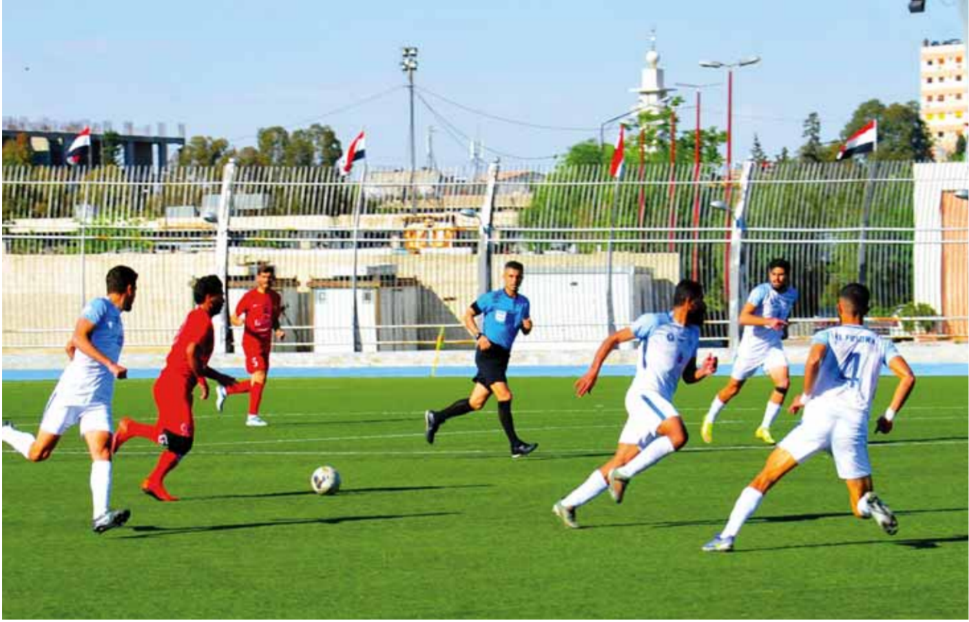
من فوز الفتوة على الجيش بملعب المحافظة الموسم الفائت (سانا)

جبلية بتعليق مشاركته في الدوري، وكان الأندية تريد الدوري على مقاسها وحسب رغبتها وحاجتها. الباب الثاني: يمثل هذه البيانات، فإن هذه الأندية ترمي بمسائلها نحو الحكام والقرارات التحكيمية واتحاد كرة القدم وتنسى أنها هي من صنعت فرقها وأسسته فإن فازت بالفوز لها وإن خسرت فالقوم على الآخرين.