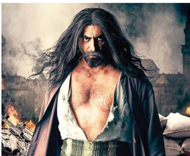
من مسلسل «العريبي»