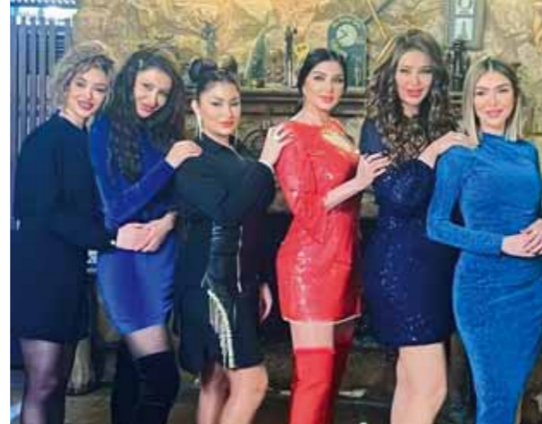
من مسلسل «صبايا»