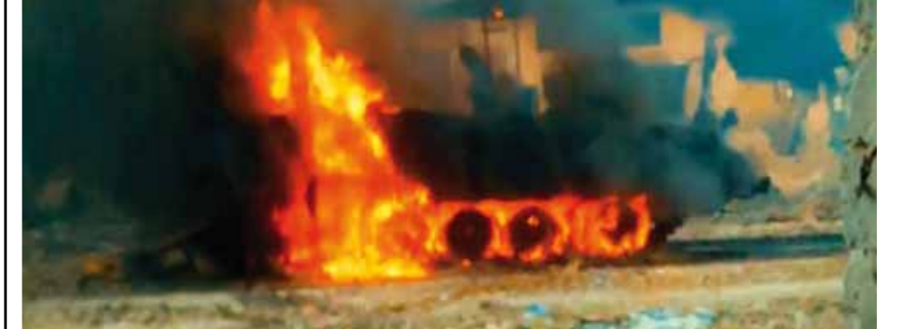
المقاومة مستمرة في تدمير آليات الاحتلال الإسرائيلي والقضاء على جنوده

محتملة في قطاع غزة تعيد حركة حماس بموجها بعض المحتجزين مقابل إطلاق الكيان الإسرائيلي سراح أسرى فلسطينيين. وقال المصدر وفق «رويترز»: إن عدد الأشخاص المقرر إطلاق سراحهم لا يزال قيد البحث، في حين تصر إسرائيل على إدراج المحتجزين من النساء والرجال الأكثر ضعفاً، مشيراً إلى أن أسرى فلسطينيين اعتقلتهم إسرائيل بعد نسب تهم لهم «بارتكاب جرائم خطيرة» يمكن أن يكونوا على القائمة أيضاً. وتأكيداً على جدية قرب التوصل إلى هدنة، قال المتحدث باسم البيت الأبيض جون كيربي: إن الولايات المتحدة تعمل من أجل هدنة جديدة في قطاع غزة «منذ انقضاء فترة التوقف السابقة»، وأضاف: «المحادثات الجارية جدية للغاية».