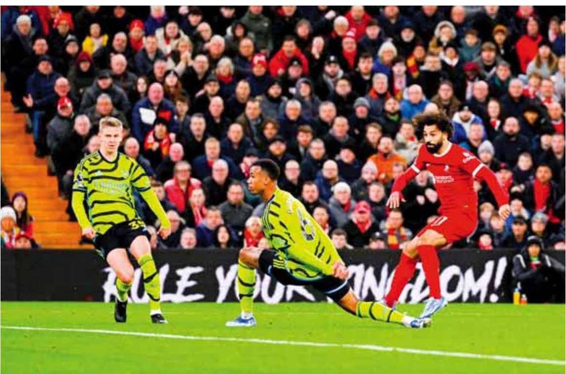
نصبيهما من اللون الأصفر.

في إيطاليا يبدو أن الإنتر يسير بخطا ثابتة نحو بطولة الشتاء ميدنياً ومن ثم استعدادة للقب وهامو يصل المباراة الحادية عشرة دون هزيمة أسبق في التعادل في تالسيو وأخفق عاد مان يونايتد سيرته الأولى خسر