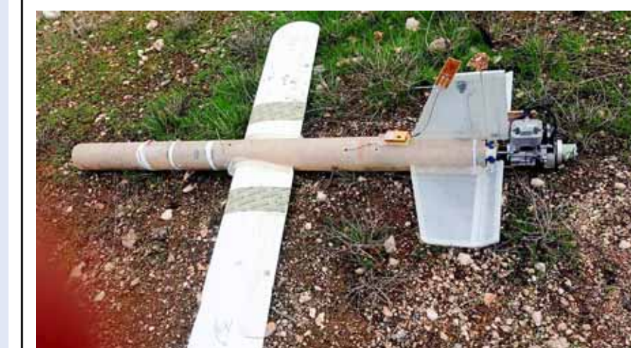
إحدى السيارات التي أسقطها الجيش العربي السوري للإرهابيين في ريفي حلب وحماة

وذكرت مصادر محلية بريف دير الزور الشرقي أنه وتحت وطأة الصدمة والهلع، استجدت «قسد» بقوات الاحتلال الأميركي التي استقدمت تعزيزات عسكرية ضخمة أسس جابت بلدات ضفة الفرات الشرقية لحمايتها من هجمات قوات العشاير العربية. وأكدت مصادر لـ«الوطن» أن حصيلة قتلى «قسد» خلال هجوم مقاتلي قوات العشاير بقذائف «ار بي جي» والأسلحة الرشاشة على نقاطها العسكرية في بلدتي الجردى والطبانية عند ضفة الفرات الشرقية، ناهز 6 قتلى وأكثر من 15 جريحاً، ما اضطر الميليشيات إلى إخلاء بعض النقاط لحين وصول تعزيزاتها العسكرية إلى البلدتين برفقة تعزيزات وسويان والشحلي إلى 10 مسلحين في يوم واحد.