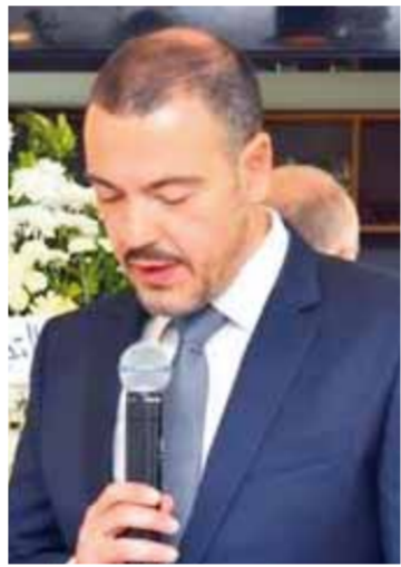
السفير الصربي فوق العادة رادوفان ستويانوفيتش

التعاوي وأن العديد من الدول العربية والصديقة تحاول سبر سبل الاستثمار وتطوير العلاقات الاقتصادية. مضمناً: إن حضور فعاليات الاقتصادية بهذه المناسبة دليل على رغبة متبادلة من الجانبين في تطوير العلاقات الاقتصادية لترتقي إلى مستوى العلاقات السياسية القائمة بين البلدين الصديقين سورية وصربيا.