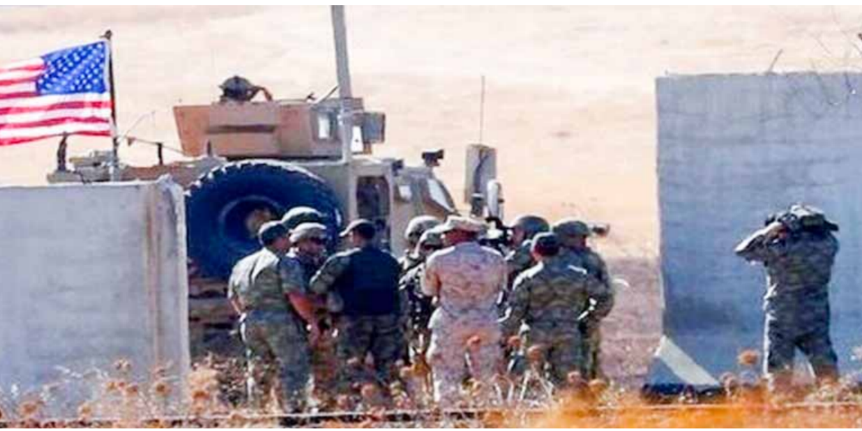
قوات جيش الاحتلال الأميركي في قاعدة التنف غير الشرعية على الحدود السورية الأردنية العراقية

الأميركيين الذين أصيبوا بهجوم طائرة مسيرة استهدفت موقعا متقدما للقوات الأميركية على الحدود «الأردنية - السورية» إلى 34 مصابا على الأقل. بموازاة ذلك، كشف مصدر أمني آخر في محافظة الحسكة في تصريح مماثل نقلته «المعلومة» عن وصول تعزيزات عسكرية أميركية كبيرة قادمة من قاعدة في الكويت إلى قاعدة التنف، وأوضح المصدر أن «التحريك يأتي لزيادة التحصينات الأمنية بعد إخفاق منظومة الدفاع الجوية الأميركية في اعتراض صواريخ المقاومة»، مبيّناً أن «القوات الأميركية اتخذت أقصى درجات الحيطة والحذر من هجمات محتملة».