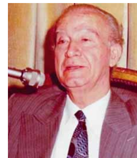
عمر أبو ريشة