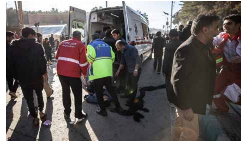
الإرهاب ضرب مدينة كرمان الإيرانية أمس تزامناً مع إحياء الذكرى الرابعة لاستشهاد الحاج قاسم سليمان

وهيتم. وأدان بشدة الجريمة الإرهابية في مقبرة الشهداء في كرمان، ووصف هذا العمل بأنه جريمة ضد الإيرانيين وأعمال إرهابية وإبتران، وقال في تغريدة على منصة «أكس»: إنه يجب على الأعداء أن ينتظروا الانتقام القاسي، فالمقاومة ستجعل الحياة أصعب فأصعب عليهم.