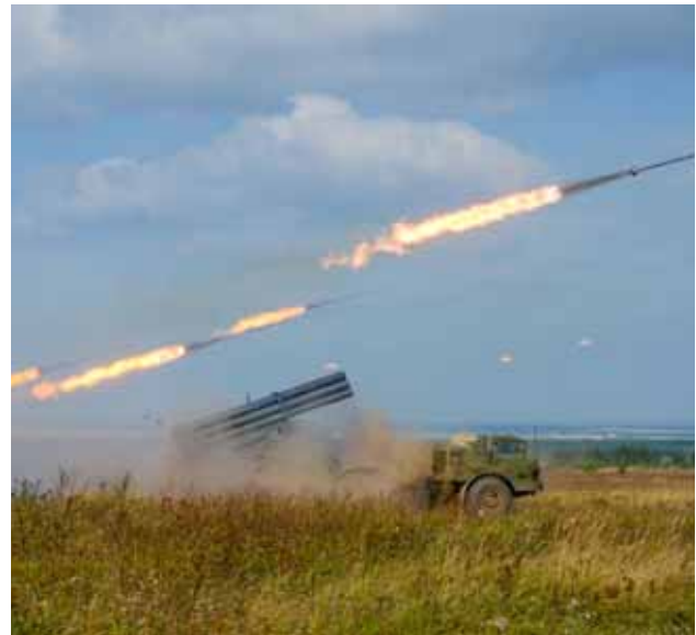
الجيش يواصل دك خطوط تماس إرهابيي «خضض التصعيد»

السوري دك خطوط تماس إرهابيي منطقة «خضض التصعيد» في ادلب والأرياف المجاورة لها، وأوقعت قتلى وجرحى كثر في صفوفهم. وأوضحت مصادر ميدانية في «خضض التصعيد» أن الجيش العربي السوري لن يتهاون في الرد على خروقات الإرهابيين المستمرة لوقف إطلاق النار، وبيّنت المصادر لـ«الوطن» أن وحدات الجيش العربي السوري قصفت أمس بمدفعتها الثقيلة خطوط التماس مع إرهابيي ما يسمى غرفة عمليات «الفتح المبين» بقيادة تنظيم جبهة النصرة في جبل الزاوية وخط المواجهة الأهم، بريف حلب الجنوبي.