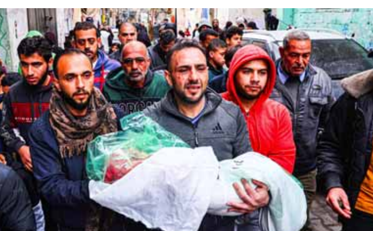
الإبادة تسببت باستشهاد وفقد وجرح أكثر من 100 ألف

تحت بند «سمح بالنشر»، اعتراف جيش الاحتلال بسقوط قتييلين إضافيين في صفوف قواته، إضافة إلى إصابته، أثناء معارك مع المقاومة الفلسطينية في شمال قطاع غزة. وأقر جيش الاحتلال الإسرائيلي، صباح أمس الأربعاء، بمقتل ضابط وجندي في صفوف قواته المتوغلة في قطاع غزة، إضافة إلى إصابة جنديين إصابات خطيرة، وذلك في المعارك البرية الدائرة مع المقاومة الفلسطينية شمال القطاع.