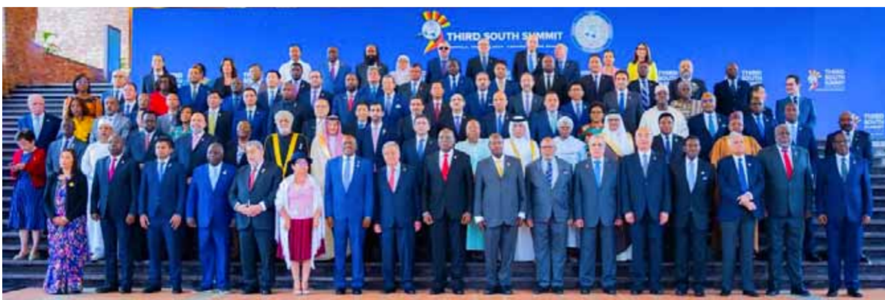
صورة تذكارية للمشاركين في قمة الجنوب الثالثة التي انطلقت أمس بمشاركة سورية في العاصمة الأوغندية كمبالا (عن الانترنرت)

ومن الضروري العمل على منع اشتعال الصراع في جميع أنحاء المنطقة.