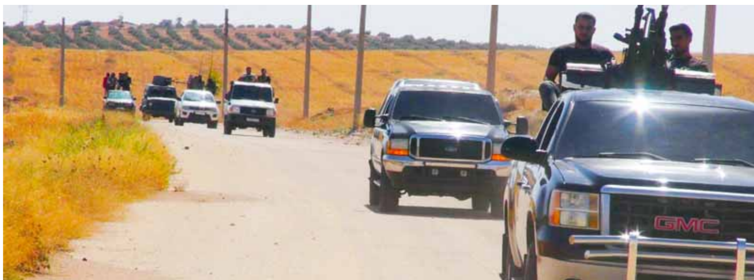
من عملية تمشيط سابقة للقوات السورية على الحدود الأردنية لملاحقة تجار المخدرات

وأشارت الخارجية إلى أن سورية تشير في هذا الصدد إلى الرسائل التي وجهها وزير الخارجية والدفاع، والأجهزة الأمنية نظراً في المملكة الأردنية الهاشمية الشقيقة، وافترحوا فيهما القيام بخطوات عملية من أجل ضبط الحدود، كما أبدوا استعداد سورية للتعاون مع المؤسسات الأمنية والأمنية الأردنية، إلا أن تلك الرسائل تم تجاهلها، ولم نتلق رداً عليها، ولم تلق أي استجابة من الجانب الأردني.