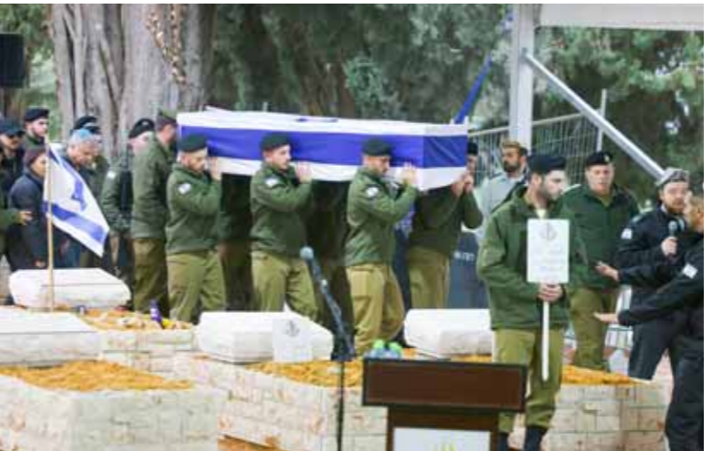
من تشييع الاحتلال الإسرائيلي لقتله جراء عدوانه على غزة

وفي محاولة مستجدة لتفجير المنطقة، وسع جيش الاحتلال قصفه الجوي إلى منطقة قريبة من مدينة صيدا اللبنانية، وتسبب القصف بتدمير ناء لرامية في إقليم التفاح على مسافة 25 كيلومتراً من أقرب نقطة حدودية، في حين ردّ حزب الله بصفق قاعدة ميرون «للمرافقة الجوية» وذلك للمرة الثانية خلال 3 أسابيع.