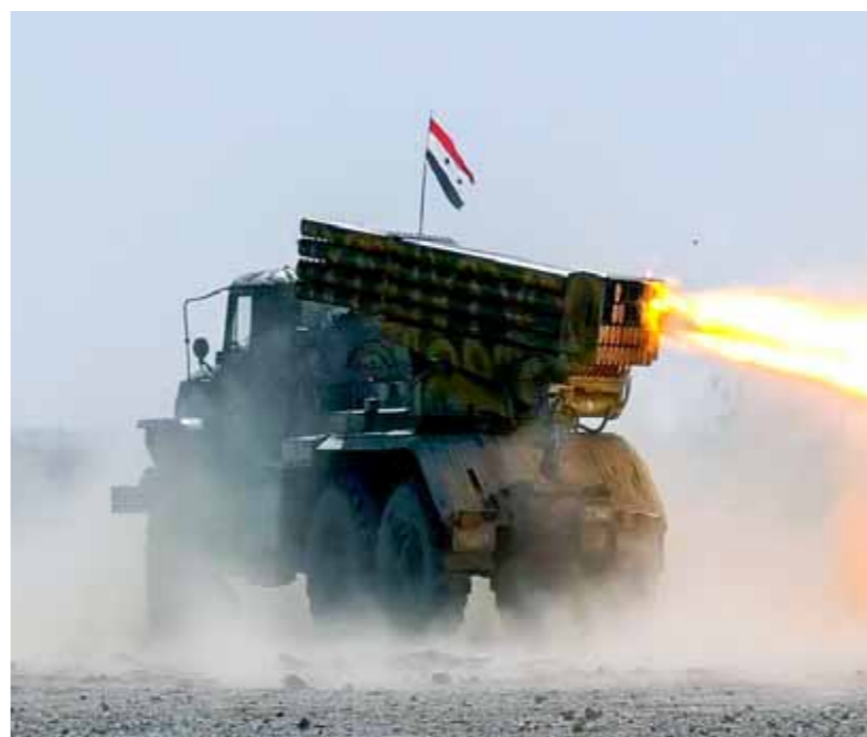
الجيش السوري أحبط محاولة «داعش» الإرهابي التسلل نحو مراكزه في بادية ريف حمص الشرقي

بريف دير الزور الشرقي، الأمر الذي أدى إلى مقتل 6 من مسلحي «قسد» الموكل إليهم حماية القاعدة، حيث اعترفت الميليشيات وأول مرة بقدانها هذا العدد من مسلحيها. على العكس السياسي، أكدت الصين معارضتها انتهاك الولايات المتحدة سيادة سورية والعراق، وشددت على ضرورة احترام أمن وسيادة كل الدول، على حين جددت إيران إدانتها للعدوان الأميركي على مواقع في البلدين، وأكدت أنه انتهاك لسيادة الدولتين وميثاق الأمم المتحدة. وأعلن المتحدث باسم وزارة الخارجية الصينية وانغ ون بين أن بكين تعارض انتهاك الولايات المتحدة سيادة العراق وسورية، وأكد ضرورة احترام أمن وسيادة وسلامة الدول كلها، وقال وانغ خلال مؤتمر صحفي: إن «سورية والعراق دولتان لهما سيادة، والصين تعارض أي أعمال تنتهك ميثاق الأمم المتحدة، وكذلك سيادة أراضي الدول الأخرى وأمنها». وأضاف: إن «الوضع حالياً في الشرق الأوسط معقد وحساس للغاية، وتدعو الصين الأطراف المعنية إلى الالتزام بالقانون الدولي على النحو الواجب، والحفاظ على الهدوء وضبط النفس، وتجنب المزيد من تصعيد التوترات الإقليمية، أو حتى خروجها عن نطاق السيطرة». إيران وعلى لسان المتحدث باسم وزارة خارجيتها ناصر كنعاني جددت التأكيد أن العدوان الأميركي على مواقع في سورية والعراق انتهاك لسيادة البلدين وميثاق الأمم المتحدة، ودعمت المجتمع الدولي إلى ردع هذه الممارسات، قائلة: لا يمكن للمجتمع الدولي أن يعتد على الدور الذي تلعبه أميركا في تحقيق السلام.