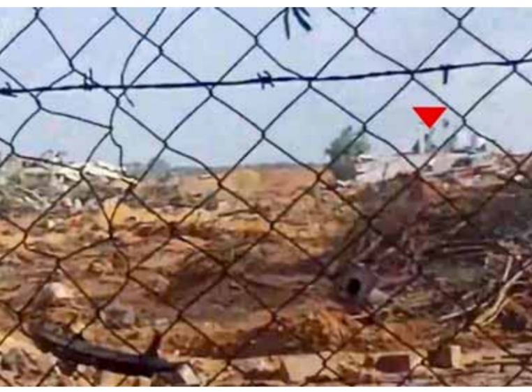
المقاومة الفلسطينية تواصل استهداف قوات الاحتلال الإسرائيلية في عدة محاور في قطاع غزة

عرض قطري يقوم على استبدال وقف إطلاق نار تام برفع عدد الأسرى الفلسطينيين المحررين». واعتبر حمدان تهديد رئيس حكومة العفو بنيامين نتانياهو بالخوّل إلى رفع «يؤكد نيته القيام بإبادة جماعية ومحاولة لتجسير الشعب الفلسطيني». وأعلن نتانياهو في وقت سابق أمس رفضه لمطالب حماس، التي أوردتها ضمن ردّها على مقترح باريس، مؤكداً عزمه القضاء الكامل على الحركة في غزة. وقال نتانياهو في مؤتمر صحفي: إنه «يجب أن تكون هناك مفاوضات عبر وسطاء، لكن ليس في ضوء رد حماس». يأتي ذلك في وقت واصلت فيه المقاومة الفلسطينية استهداف قوات الاحتلال الإسرائيلية في عدة محاور في قطاع غزة، معلنة تكبيدها خسائر جديدة في الأرواح والعتاد، في حين عاد جنود الاحتلال القلبي في قطاع غزة يرتفع وجيش الاحتلال يقر بمقتل جندي إضافي، بالتزامن مع إقرار رئيس السلطة المحلية في مستوطنة «كريات شمونة» أن هناك إصابات كل يوم جراء صواريخ حزب الله المضادة للبرو، وأنه حالياً لا إمكانية لعودة المستوطنين إلى منازلهم بوجود هذا الخطر. من جهته واصل الاحتلال الإسرائيلي عوانه جواً وبراً وبحراً على الأهالي في قطاع غزة وخصوصاً على مدينتي رفح وخان يونس جنوب القطاع، ما أدى إلى سقوط المئات بين شهيد وجريح، وأعلنت وزارة الصحة الفلسطينية أمس أن الاحتلال الإسرائيلي ارتكب خلال الـ24 ساعة الماضية 16 مجزرة في قطاع غزة راح ضحيتها 123 شهيداً و169 جريحاً.