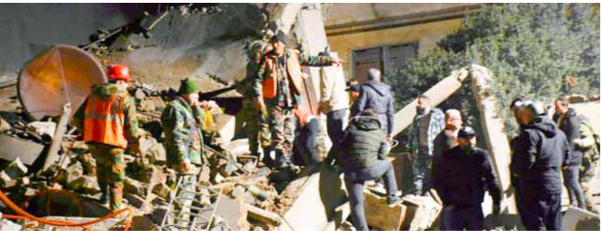
استهداف وإصابة عدد من المدنيين نتيجة عدوان إسرائيلي استهدف خلاله نقاطاً في مدينة حمص وريفها

الريفية في مدينة نوى بريف درعا الغربي، وقبل ذلك تم تنفيذ عمليات في مدينة جاسم وبلدة البادودة ومناطق أخرى. إبراهيم رئيسي أن الوجود الأميركي في سورية والعراق يمثل تهديداً للأمن في المنطقة، وشدد على أنه لا مبرر لبقاء القوات الأميركية فيها. وفي كلمة ألقاها أمام السفراء المصنفين في طهران مع اقتراب الذكرى الـ45 لانتصار الثورة الإسلامية في 12 شباط، أكد الرئيس الإيراني أن «لا مبرر» لبقاء القوات الأميركية في الشرق الأوسط حيث يمثل وجودها «تهديداً للأمن»، ورأى أن قضايا المنطقة يجب «أن تتم معالجتها من قادة المنطقة».