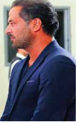
من مسلسل «مدرسة الحب»

اليوم سنستذكر بعض تلك الأعمال التي كان الحب وعلاقات العشق عامودها والفقرى أو ربما كان أحد أهم خطوطها الرئيسية. ويعد مسلسل أهل الغرام بأجزائه الثلاثة من أهم وأبرز الأعمال السورية التي سلطت الضوء على قصص الحب والعلاقات الاجتماعية، فهو يجبر عينيك على ذرف الدموع مع نهاية كل حلقة أو ربما يمرور مشهد فراق بين محبين اثنين، فتتفاعل مع أبطال الحكاية وتخال نفسك واحداً منهم على الرغم من أنه يقدم لوحات منفصلة تروي كل واحدة منها حكاية مختلفة عن الأخرى، فتكلم العمل بلسان حال المشاهد