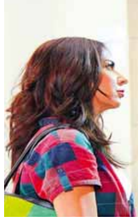
من مسلسل «أهل الغرام»

ووجدانه وربما ذكرياته، ولكن القاسم المشترك في العمل هو أن جميع حلقاته توحى بالفشل ولا يكتب لها الإستمرار. ويعود سبب ذلك للانفصال ربما إلى عارض ديني وطائفي أو لتعثر الإنجاب في حال تم الزواج أو لعللة السر أو لعارض مرضي وما إلى ذلك، فتتعدد الأسباب والنهاية واحدة، ومن أبرز لوحات العمل (العام الجديد، يا مريم البكر، لو على قلبك، ذكك حلو، نسيم علينا الهوى، بعدك حبيبي، أنا لحبيبي).