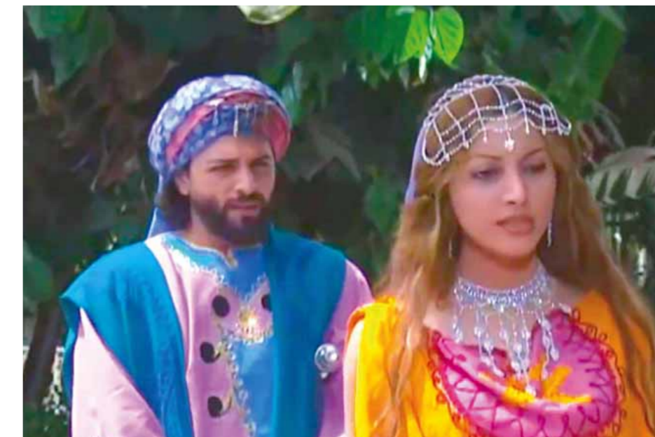
من مسلسل «ربيع قرطبة»

استخدامها في العمل، كما يتم في الدراما التاريخية الاستعانة بالجموع والأعداد الكبيرة من الكومبارس وهو ما يصعب على المخرج ومساعدته التحكم بكل هذا العدد من الأشخاص، إضافة إلى المهن الكثيره اللازمة لذلك من خياطة البسة من نوع خاص وتعديلات في الوجود والشعر بطريقة مختلفة وكذلك الخيول والجمال وتأمين عدد كبير من السيوف والرمح وما إلى ذلك، فإن كل ما سبق ربما يكون عائقاً كبيراً في سبيل تقديم مادة درامية تاريخية متقنة ومقنعة، وهو ما كشفه المخرج السينمائي زين أنزور مشيراً إلى أن طبيعة الأعمال التاريخية تفرض على منتجها أن يفكر ملياً ويجري حسابات دقيقة قبل الخوض في هذه التجربة بحيث أنها تتطلب مبالغ مالية هائلة وجهة إنتاجية قوية، منوهاً بأنه قدم مؤخرًا كثيرًا من المحاولات ولكن طبيعة الحال كان يتم توجيه هذه المحاولات بسبب طبيعة الصراعات التي تشهدها المنطقة، فلم تكن لهدف درامي سردي ومن أجل الاحتفاء بالتاريخ العربي العريق أو قاداته العظماء.