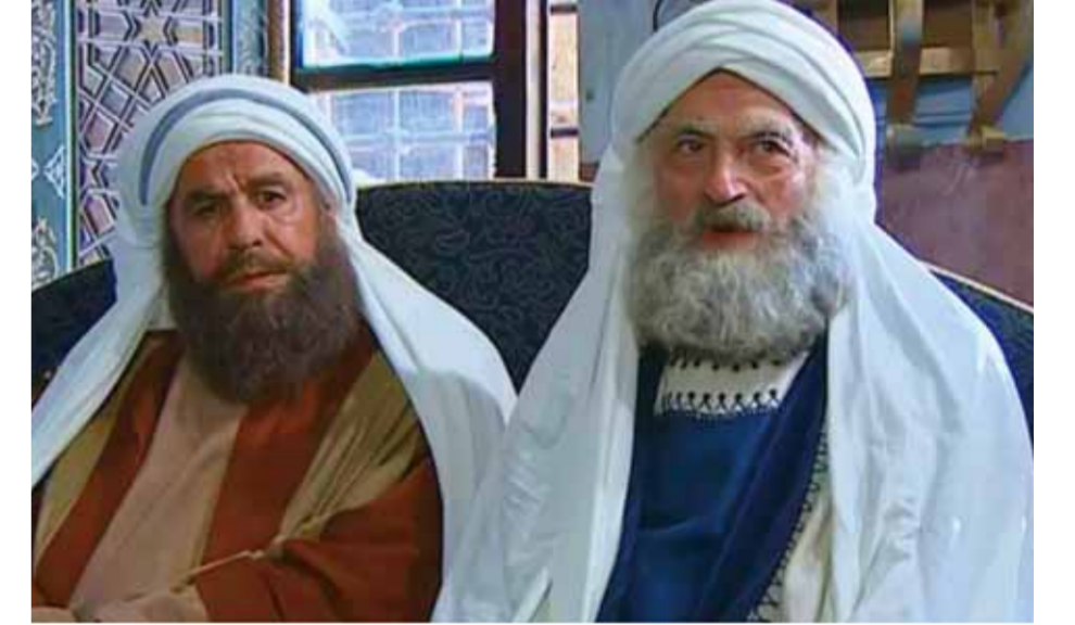
من مسلسل «صقر قریش»

أسباب، ولعل أهمها طبيعة الصراعات التي تشهدها المنطقة مؤخراً والتي تعددت أشكالها بين السياسي والعربي والديني وما إلى ذلك، وهو ما جعل صناع الدراما من مؤلفين وممثلين وحتى فنانين يبتعدون عن إثارة الفتن من خلال تلك الأعمال والتي ربما تثير الكثير من الإشكاليات وإشارات الاستفهام، ولكي لا يصنف الدراميون على أنهم إلى هؤلاء أو أولئك أو غيرهم.