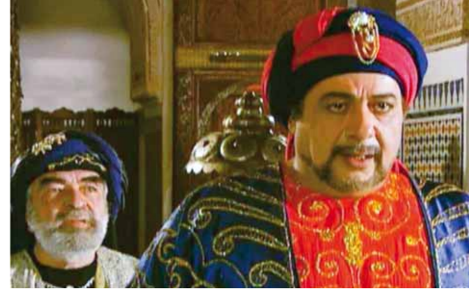
من مسلسل «ملك الطراقة»

هل يمكن أن تغني تلك الأعمال عن قراءة كتب التاريخ؟ ولماذا هي غائبة اليوم؟