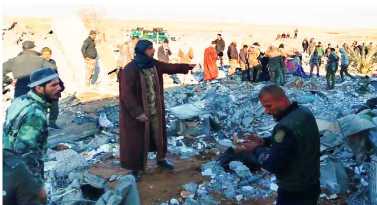
من آثار العدوان الأميركي

وإعلانها أن أحد الأهداف الرئيسية للعدوان الأميركي، الذي استهدف مواقع في دير الزور وريفها وفي الميادين والموصل، هو إطلاق يد «داعش» ضد الجيش العربي السوري وحلفائه في المنطقة التي انتعش فيها من جديد بغض النظر عن محدود قوت الاحتلال الأميركي. واللافت أن المواقع والنقاط المستهدفة بالعدوان الأميركي سبق أن أحلى مظهرها باستثناء النقاط الواقعة على خطوط تماس مواجهة «داعش»، والتي تتخذ منها وحدات الجيش العربي السوري مناطق متقدمة للتصدي لمحاولات تسلل إرهابي التنظيم، ولا يجوز إخلؤها وترك الطريق مفتوحاً لتسلل الإرهابيين إلى المناطق المأهولة بالمدنيين. كل هذه المعلومات تؤكد أن استهداف كتيبة الجيش العربي السوري في بلدة عياش غرب دير الزور، والتحاديث للبيادة، وكذلك قرية الهري على بعد 5 كيلو مترات إلى الشرق من مدينة الموصل، يصب في الاتجاه ذاته ومن أجل المساعي الرامية إلى جعل التنظيم الإرهابي «ذراعاً ميدانية» للاحتلال الأميركي الذي بات معروفاً أنه هو من أسس لهذا التنظيم ورعاه لتحقيق مآربه وأجندته الميدانية والسياسية.