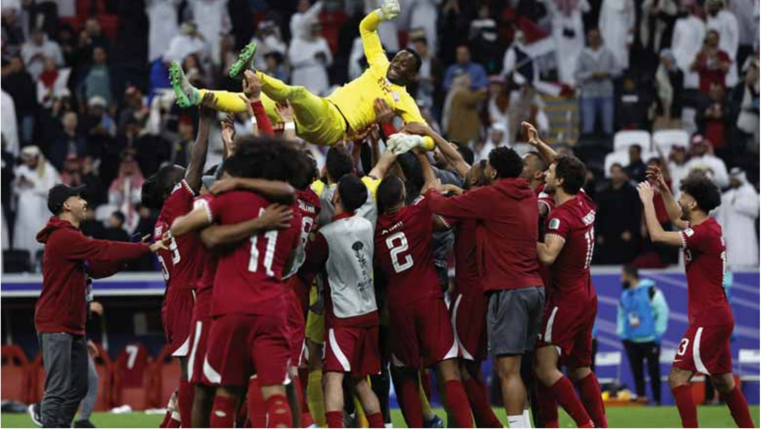
من فرحة المنتخب القطري بالتأهل إلى المربع الذهبي

في اليوم الثاني لربع نهائي أمم آسيا ٢٠٢٣