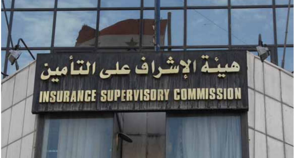
عبد الهادي شباط

حمل إعلان هيئة الإشراف على التأمين عن نيتها إطلاق تطبيق إلكتروني خاص بحوادث السيارات المؤمن عليها، الكثير من التساؤلات عن سببه وتوقيتته والكلفة المترتبة عليه. ويؤكد مدير عام هيئة الإشراف على التأمين رافع محمد أن صاحب المركبة المؤمن عليها والذي يرغب في الاشتراك وتفعيل هذا التطبيق لن يتحمل أي تكاليف إضافية عن قيمة عقد التأمين الأساسية وأن التطبيق يسمح بسيط أي حالات تجاوز أو سوء استخدام في عقود التأمين على المركبات كما يمكنه حضور قوائم خاصة بالسائقين الأكثر تسبباً بالحوادث، منوهاً إلى أن البيانات والمعلومات التي يوفرها التطبيق ستكون مفيدة لكل الجهات المعنية بالحوادث المرورية. وأوضح مدير عام الهيئة أن مدة التنفيذ للتطبيق الإلكتروني الخاص بمطالبات المركبات سيكون بحدود ٦ أشهر بعد تأسيس قاعدة بيانات لدى الهيئة ووصولها مع شركات التأمين. وأوضح أن الهيئة تعتبره ضرورة ملوكية لتفعيل التأمين في هذا المجال ويتناغم مع التوجهات الحكومية بالتوسع في التطبيقات