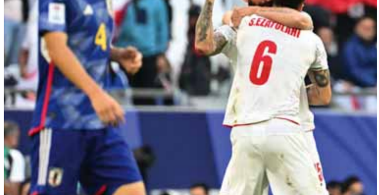
من فوز المنتخب الإيراني على اليابان

ومن أبرز الأرقام الخاصة بالمباراة أن منتخب اليابان خسرت مرتين في بطولة واحدة للمرة الأولى منذ نسخة ١٩٨٨ في قطر عندما تعرض حينها لثلاث هزائم أمام كل من الإمارات وكوريا الجنوبية وقطر. وحقت إيران الفوز الأول على اليابان التي كانت تشكل لها عقدة تاريخية، والأمر لا يتعلق بمجرد عدم الفوز وإنما مرمى المنتخب الياباني المستعصى على إيران في كل المباريات السابقة التي جمعت المنتخبين وعدها أربع، حيث تعادلا سلباً عام ١٩٨٨ ثم فازت اليابان بهدف عام ١٩٩٢ وتعادلا صفر/صفر عام ٢٠٠٤ وفازت اليابان ٣/٠ صفر في البطولة الفائتة.