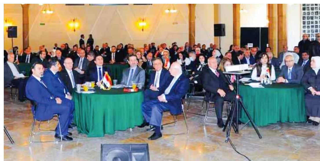
وزير الصحة حسن الغياش يفتتح ورشة العمل الوطنية للتحكم بالسرطان في جامعة دمشق.

كما ركزت على خدمات مكافحة السرطان المقدمة في القطاع الحكومي ومن المنظمات الدولية، وخدمات التحكم بالسرطان بما يخص الكوادر البشرية ونظام المشافي ومراكز الأورام في وزارة الصحة، إضافة إلى آنية توزيع الخدمات المتعلقة بذلك على مستوى المحافظات. نقاشات موسعة تمت بين جميع الجهات المعنية بالتحكم بالسرطان من وزارات