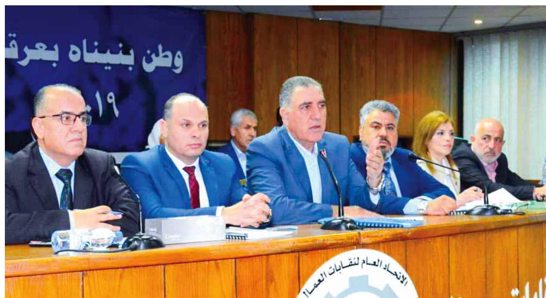
محمود الصالح يفتتح ورشة العمل الوطنية للتحكم بالسرطان في جامعة دمشق.

قيمة الوجبة الوقائية بما يتناسب مع الواقع المعيشي أو إعطائها عينية، وصرف بدل الإجازات للعمال، وتشغيل العمال بالتأمين الصحي بعد التقاعد، وفتح سقف الرواتب والأجور والإعفاء الضريبي لكامل الأجر، ومنح العاملين طبيعة العمل ليكون حسب الراتب الحالي وفق المرسوم