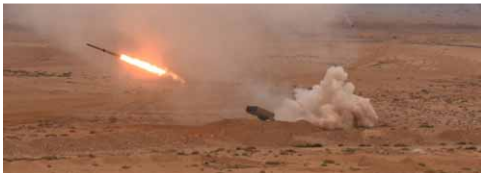
قوات الجيش العربي السوري في البداية السورية