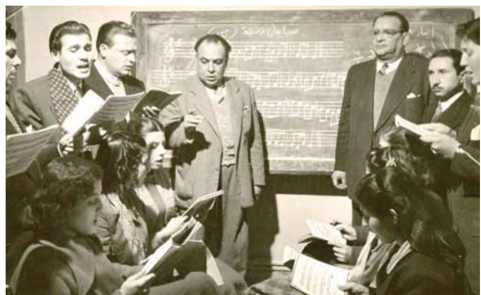
كرال إذاعة دمشق في مطلع الخمسينيات

كانت الدراما مرتبطة بإذاعات AM ذات المجال الواسع