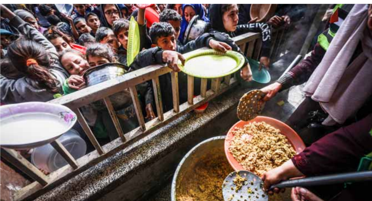
مئات أسماء خربت في بيان مشترك من أن حياة الأطفال في غزة مهددة بسبب ارتفاع معدلات سوء التغذية (أ.ب)

أجريت في اللاجئي والمراكز الصحية والغذائية، ومن ثم في مدارس الأطفال، في الشمال إلى ١٠٠٠ بائقة أو واحد فقط غزة يشغل تهديدات خطيرة تستهمم، وفق تحليل جديد أصدرته مجموعة الأغذية العالمية، على وجود النقص في قطاع غزة. وأشارت المنظمات الإنسانية إلى أن الوضع خطير للغاية، حيث يعاني أكثر من ٦ أطفال من سوء التغذية الحاد، وذلك حسب قوائم موقع «اليوم السابع» المصري. وأكد البيان أن ارتفاع الحاد في معدلات سوء التغذية بين الأطفال والنساء والحوامل والطفولة فقرت قطاع غزة يشغل تهديدات خطيرة تستهمم، وفق تحليل جديد أصدرته مجموعة الأغذية العالمية، على وجود النقص في قطاع غزة. وأشارت المنظمات الإنسانية إلى أن الوضع خطير للغاية، حيث يعاني أكثر من ٦ أطفال من سوء التغذية الحاد، وذلك حسب قوائم موقع «اليوم السابع» المصري. أجريت في اللاجئي والمراكز الصحية والغذائية، ومن ثم في مدارس الأطفال، في الشمال إلى ١٠٠٠ بائقة أو واحد فقط غزة يشغل تهديدات خطيرة تستهمم، وفق تحليل جديد أصدرته مجموعة الأغذية العالمية، على وجود النقص في قطاع غزة. وأشارت المنظمات الإنسانية إلى أن الوضع خطير للغاية، حيث يعاني أكثر من ٦ أطفال من سوء التغذية الحاد، وذلك حسب قوائم موقع «اليوم السابع» المصري.