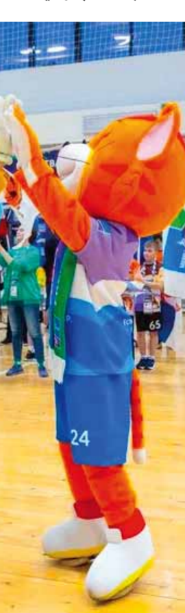
من هذا الفوز التاسع للفتوة.

في مباريات الثلاثاء من كأس الجمهورية لكرة القدم