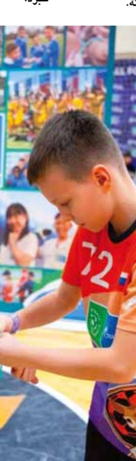
من هذا الفوز التاسع للفتوة.