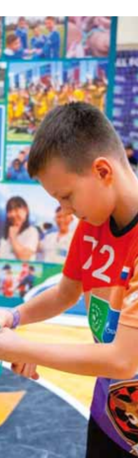
من هذا الفوز التاسع للفتوة.