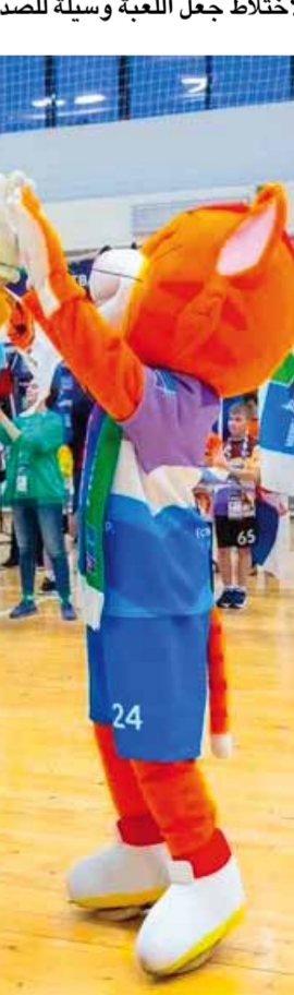
من هذا الفوز التاسع للفتوة.