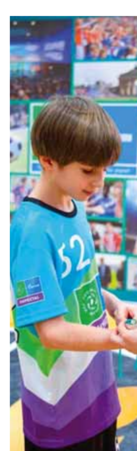
من هذا الفوز التاسع للفتوة.

يذكر أن المنافسات بدأت أمس وتستمر حتى ٢٤ شباط الجاري وسيحصل المشاركون على شهادات المشاركة وبعض الهدايا التذكارية.