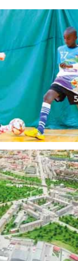
من هذا الفوز التاسع للفتوة.