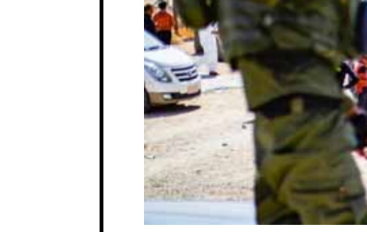
سناء وأطفال داخل مخيم «الجزء» الذي يقع تحت سيطرة ميليشيات «قسد» (أريش - أريش)

أعلنت جمهورية قبرصستان استعادة ٩٩ امرأة وطفلاً من رعاياها الذين كانوا محتجزين في مخيمات التي تديرها ميليشيات «قوات سورية الديمقراطية» قسد» في شمال شرق سورية، في وقت فكت فيه روسيا دعواتها لمنع تنظيم «قسد» للفرار من سورية، وذلك بالتعاون مع القوات السورية المسلحة في محافظة إدلب، وذلك بالتعاون مع القوات السورية المسلحة في محافظة إدلب.