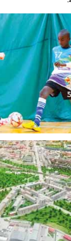
من هذا الفوز التاسع للفتوة.