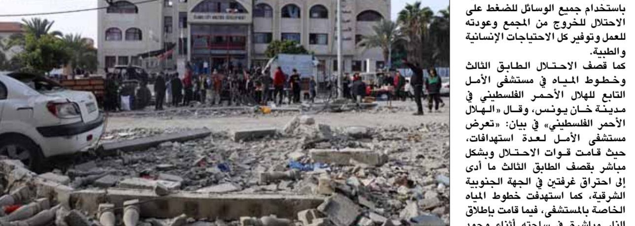
من استهداف قوات الاحتلال الإسرائيلية للأهل في قطاع غزة

أعلنت مهمة إجماع ثمانية من المجتمع، وبمساعدة وزارة الصحة الفلسطينية، وعلى توقيع «يوم السابع» في حالة خرجه، من بينهم أطفال، وسع استمرار العدوان الإسرائيلي، وتكررت المنظمه إن مجمع ناصر وهو وفلت أكبر مستشفى في غزة، توقع من العمل الأسبوع الماضي عند زيارة الطبيب والرؤساء الطبيين الذين