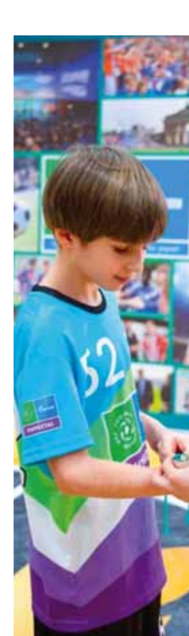
من هذا الفوز التاسع للفتوة.

حصد الفتوة الفوز على حطين في هذا الموسم وينفخ نتيجة الذهاب وأعاد الفارق إلى ما قبل موقعه الكرامة متوجهاً جهود لاعبيه وكادره التدريبي بالعوسا إلى ستة الانتصارات متناسفاً إحقاق الكرامة في المرحلة السابقة المباراة كانت جيدة من الفتوة أسلوبياً وانتشاراً وسيطرة وحتى التبديلات التي أجراها المدرب السهو المكلف قيادة المباراة كانت منطقية وفي محلها وكان لإشراك الثنائي البحر والحسين في الهجوم دوراً في الإمتداد الهجومي الذي كلف أصحاب الأرض التراجع والتعرض لهدف ملعوب ولا أحلى في الدقيقة ٣٠ ما أربك الحيطان الذين اتبعوا الأساليب المشروعة وغير المشروعة لتحقيق التوازن لكن أفضلية الأزرق هي التي استمرت حتى النهاية وعلى الرغم من النشاط الملحوظ في الشوط الثاني أجبر الفتوة على التراجع والتوقع في منتصفه لكن بلا خطورة للحيطان الذين طالبوا بركلة جزاء للحديث لكن الحكم كان قريباً من الصواب ولم يتخذ أي قرار يعدها توقفت المباراة، فماداً قال المتابعون من هذا الفوز التاسع للفتوة.