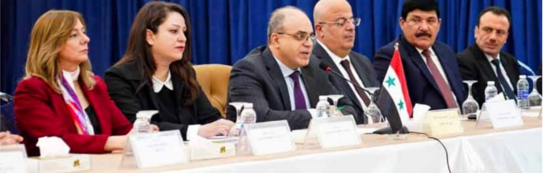
الوفد السوري في اجتماع اللجنة السورية - العراقية المشتركة في العاصمة العراقية بغداد (من الانترنت)

رئيس الوفد السوري في اجتماع اللجنة السورية - العراقية المشتركة في العاصمة العراقية بغداد (من الانترنت) رئيس الوفد السوري في اجتماع اللجنة السورية - العراقية المشتركة في العاصمة العراقية بغداد (من الانترنت) رئيس الوفد السوري في اجتماع اللجنة السورية - العراقية المشتركة في العاصمة العراقية بغداد (من الانترنت) رئيس الوفد السوري في اجتماع اللجنة السورية - العراقية المشتركة في العاصمة العراقية بغداد (من الانترنت)