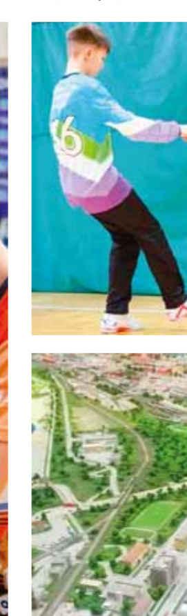
من هذا الفوز التاسع للفتوة.