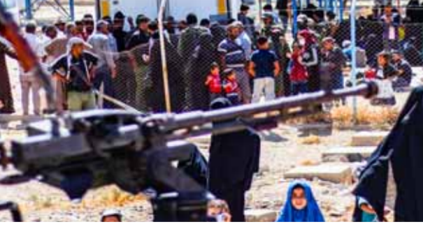
الإمارات تزود ١٥ ألف سلة غذائية وأنبية في ٧ محافظات

وقال مدير تنسيق المساعدات الإماراتية في سورية «جزء من الأمانة السورية للتنمية» تصريح له: إن هذه المبادرة تأتي وفقاً لقرار مجلس أمنها الذي يتناول «مبادرة توزيع المواد الغذائية وإعادة الإعمار» من قبل مجلس الأمن، وتحت إشراف اللجنة الاقتصادية والاجتماعية لغربي آسيا (الأمم العربية)، بهدف توفير الدعم المالي للمناطق المتضررة، وذلك بالتعاون مع المنظمات الإنسانية الدولية، وذلك بالتعاون مع المنظمات الإنسانية الدولية، وذلك بالتعاون مع المنظمات الإنسانية الدولية.