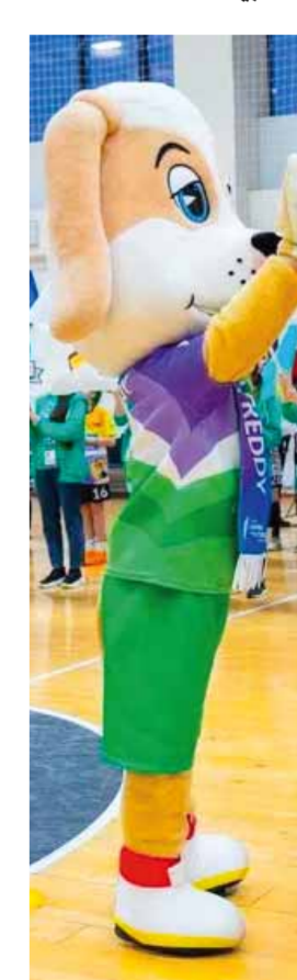
من هذا الفوز التاسع للفتوة.