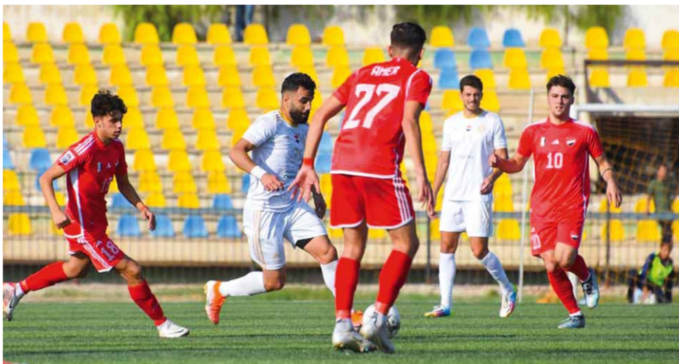
من لقاء الفريقين نهائياً