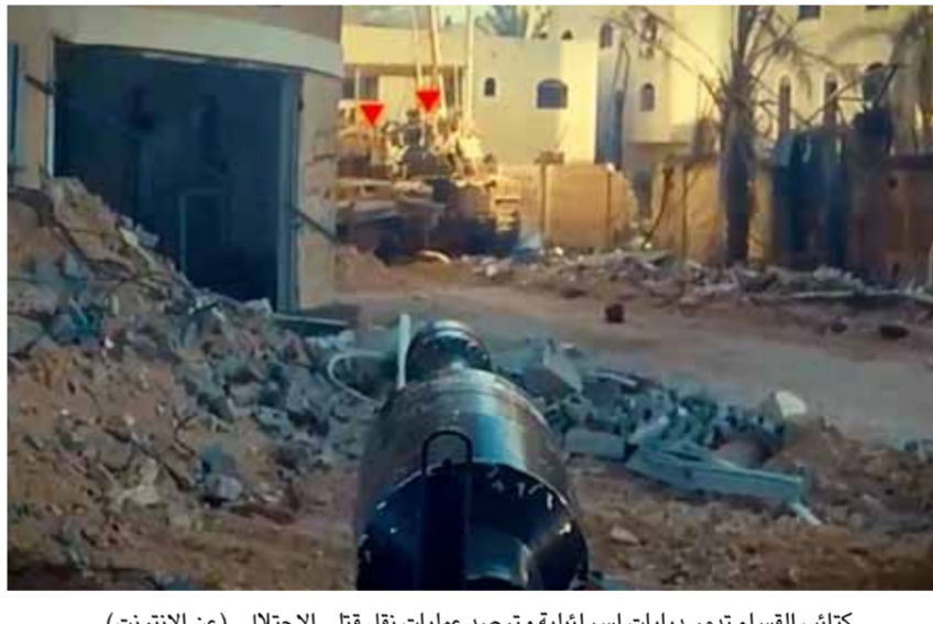
كثافت القسم تدمر دبابات إسرائيلية وترصد عمليات نقل قتلى الاحتلال

الوطن تكتفت التحركات والاتصالات السياسية للتوصل إلى اتفاق هدنة غزة قبيل شهر رمضان، وعزز تصريح الرئيس الأمريكي جو بايدن حول موافقة حكومة العدو على وقف إطلاق النار من احتمالية الإعلان القريب عن الاتفاق. وكالة «أسوشيتد برس» قالت: إن الاتفاق يبدو أنه بدأ في التبلور، ونقلت عن مسؤول مصري كبير قوله إن الخطوط العريضة للاتفاق ستشتمل دخول وقف إطلاق النار لمدة ستة أسابيع حيز التنفيذ، وستوافق «حماس» على إطلاق سراح ما يصل إلى 40 رهينة، معظمهم من النساء المدنيات، بالإضافة إلى طفلين على الأقل، والأكبر سنًا والمرضى، وفي المقابل ستطلق إسرائيل سراح ما لا يقل عن 300 أسير فلسطيني، وستسمح أيضاً للفلسطينيين النازحين بالعودة إلى مناطق معينة في شمال غزة.