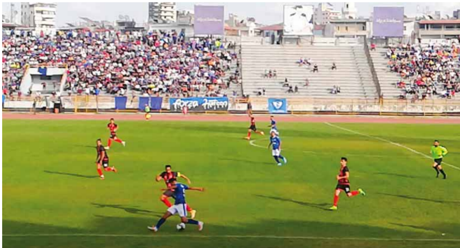
من فوز حطين على الجيش نهائياً

برام، وصاحب الأرض لا يريد التفرط بالنتائج لأن الصيادين خلف المسار كثر ويريدون أن يتقنوا على الفريق ولو باستمهم، من هنا نجد أن الكرامة عازم على تحقيق فوز يرتقي به درجة نحو الأمام ويستك به كل معارضيه.