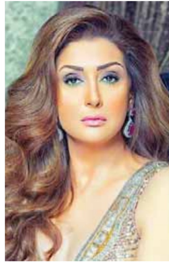
غادة عبد الرزاق