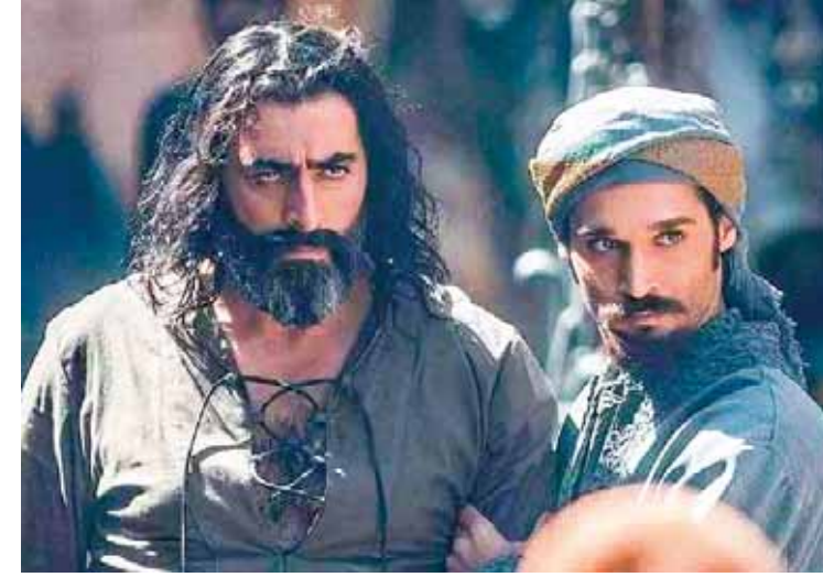
من مسلسل «العرجي ٢»

على ٢٦ مسلسلاً طويلاً وقصيراً، مع تفاوت كبير بين مسلسل وآخر. ومع تسويق معظم هذه الأعمال في السوق العربية، فإن هذا المبلغ قد عاد إلى جيوب المنتجين مع نسب ربح ليست بالقليلة، خاصة مع الكم الكبير من الإعلانات التجارية التي ترافق المسلسلات السورية والتي تعود فائدتها إلى أصحاب القنوات الفضائية. ليعم الريح على العمل على اعتبار أن رمضان شهر نزوة العمل الإعلاني والإنتاجي الدرامي، وبالتالي الغروض عليها. وخلال الموسم الدرامي الماضي، وصلت تكلفة إنتاج المسلسلات السورية إلى أرقام قياسية تبدو غير متوقعة للوهلة الأولى، لكنها توضح نسبة التعافي الكبير الذي بدأ يظهر جلياً كما ونوعاً على مسلسلاتنا الدرامية السورية فصرت هذا العام فقط مبلغ ٣١٠ مليارات ليرة سورية توزعت