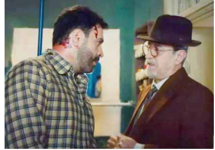
من مسلسل «تاج»

تعيش الدراما السورية حالة من الانتعاش مع اتساع رقعة العروض الرضائية عبر ٣٦ قناة ومنصة محلية وعربية، هي الأكثر أهمية ومتابعة. فبعد سنوات من المقاطعة العربية لإنتاجنا الدرامية، بدأ عصر الانفتاح تزامناً مع الانتصارات السياسية والعسكرية التي تحققتها الدولة السورية لتنفذ درامانا الغبار عن أزمة حادة عاشتها وتعلن دخولها مرحلة جديدة تنسم بالنهوض وإعادة الألق واستعادة الزمن الجميل. الدراما التي تعد إحدى الصناعات الثقيلة في سورية لم تتوقف يوماً رغم تكاليفها الباهظة مع دخولنا الاقتصادية التي تعيشها منذ اندلاع الحرب الإرهابية عليها عام ٢٠١١. وتتمتلك شركات الإنتاج السورية خبرة طويلة، لذا فهي تعرف كيف تصرف وتتصرف لتخطي الصعوبات والظروف غير الاعتيادية، لأنها تمتلك العنصر الأهم في الدورة الإنتاجية وهو الكوادر الفنية المحترفة.