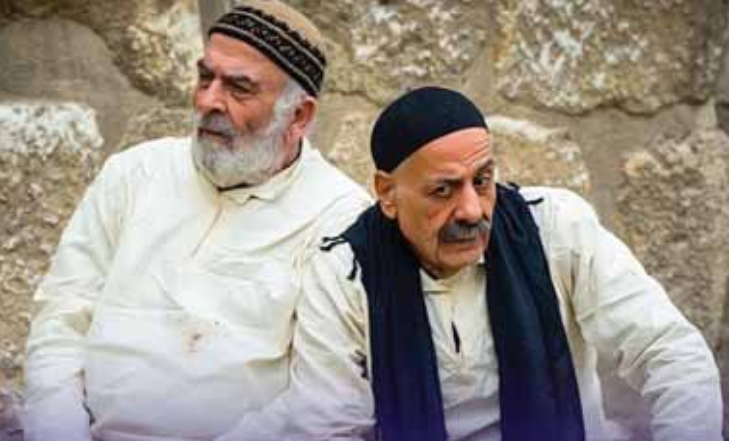
من مسلسل «بيت أهلي»