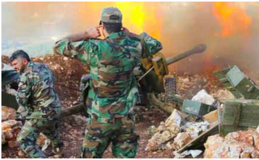
وحدات من المدفعية في الجيش السوري تستهدف الإرهابيين في ريف إدلب الجنوبي

العديد من الدواعش وتدمير عتاد حربي لهم، وفرار الناجين باتجاه عمق البادية. في غضون ذلك، أعلنت وزارة الخارجية التركية أمس توقف أي مفاوضات بشأن تطبيع العلاقات بين دمشق وأنقرة، زاعمة أن لا شروط مسبقة لديها من هذا الإطر. وقال المتحدث باسم الخارجية التركية أونجو كتنشالي: إنه لا يوجد «تقدم» حالياً في المفاوضات بين دمشق وأنقرة، وأوضح في إفادة صحفية بأن أنقرة، أنه فيما يتعلق بمسؤولية وزارة الخارجية، ليس لدينا مفاوضات مع القيادة السورية، وأضاف: إن «سياستنا بشأن التطبيع معروفة منذ البداية، وقد قمنا بصياغتها بشفاافية، ليس لدينا شروط مسبقة،