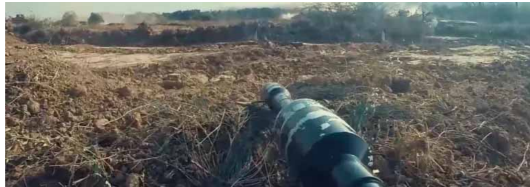
المقاومة الفلسطينية تشتبك مع قوات الاحتلال بمحاور عدة في قطاع غزة