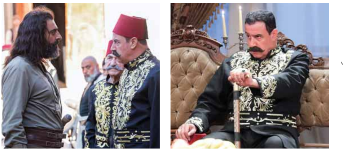
الحسكة - دحام السلطان

لأداء الدور كما هو على الرغم من العروض الفنية التي انهالت عليه، لآداء أدوار مهمة في أعمال مهمة مثل «أولاد بديدة»، للمخرجة رشما شربتجي، و«الوشم» وعمل ثالث اعتذر عنه أيضاً لمشاركته في مهرجان «الشارقة الصحراوي» المسرحي، التي ستقود وتتنامى حالة الصراعات هذه، وبعد ظهور ابنته ودخولها في صلب العمل، التي بدورها ستشاطرهُ الانتهازية ذاتها وتتم إكمالها لسلك طريق الوصول إلى تعزيز حالة الأنا المغيبة بطريقة مبتذلة ومصحلة الشخصية في السر، ومن ثم المصلحة دولة العلية «زيفا» في العلن؛ وليعبع الدور ذاته في الجزء الثاني الذي يعرض حالياً بعد تطوير أداء الشخصية وتعدد فعلها.