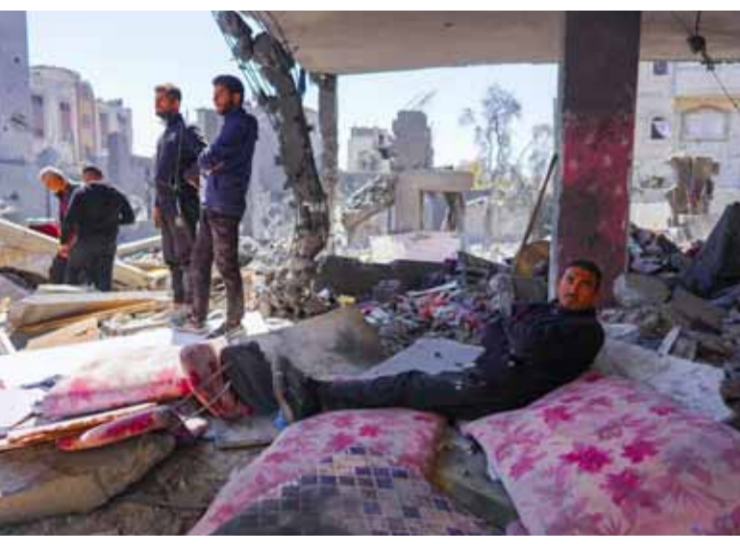
فلسطينيون على أنقاض منازلهم بعد قصف للاحتلال الإسرائيلي على غزة

الخارجية المصرية: إن وزراء خارجية عرب سيجتمعون اليوم الخميس بوزير الخارجية الأميركي أنتوني بلينكن في القاهرة. وسيجتمعون مع كل من وزراء خارجية مصر والسعودية والأردن وقطر ووزير الدولة الإماراتية لشؤون التعاون الدولي، وأمير سر اللجنة التنفيذية لمنظمة التحرير الفلسطينية. بدرها قالت صحيفة «واشنطن بوست» نقلاً عن مسؤولين أميركيين: إنهم لا يتوقعون أن تسفر زيارة وزير الخارجية الأميركي للمنطقة عن اختراقات كبيرة. وكان رئيس وزراء العدو قال في تصريحات له أمس: إن الاستعدادات جارية لاجتياح رفح في جنوب قطاع غزة، مشيراً إلى أن هذا التحرك «سيستغرق بعض الوقت»!