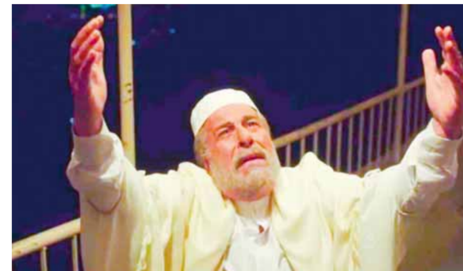
تيسير إربيس في مسلسل «ولاد بديعة»