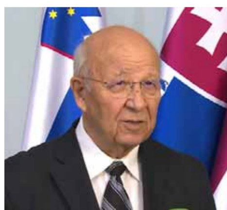
مدير هيئة الطاقة الذرية إبراهيم عثمان

وكالة «رويترز» كانت نقلت عن مصدر مطلع قوله: إن محادثات وقف إطلاق النار في غزة وإطلاق سراح الأسرى مستمرة، كاشفاً أن مسؤولي «الموساد» ما زالوا في العاصمة القطرية الدوحة. من جهتها نقلت قناة «المبايدن» عن مصدر خاص في المقاومة الفلسطينية تأكيد أنه المفاوضات مستمرة على الرغم من الاستعصاء فيها، وأضاف المصدر: إنه على الرغم من كل ما أبدته حماس من مرونة، وخصوصاً في قضية الأسرى، فإن «إسرائيل نزلت في سقف ردها إلى الحد الأدنى». وأشار إلى أن «إسرائيل لم تأت على ذكر وقف إطلاق النار، ولم تقدم اقتراحاً واضحاً بشأن الانسحاب من المناطق المكتظة»، مضيفاً: إن الاحتلال «يسعى لتكريس وجوده في شمال قطاع غزة ووسطه وشرقه وجنوبه، كما هو واضح». وأكد المصدر أن «حماس والمقاومة تصران أيضاً على رؤية الخرائط، وأن تشمل الصفقة انسحاباً إسرائيلياً كاملاً من القطاع». بدورها أفادت مصادر صحفية في القطاع بوقوع 15 شهيداً على الأقل، بينهم 4 أطفال، وعشرات الإصابات في قصف إسرائيلي استهدف منزلاً بؤوي نازحين شمال رفح جنوب قطاع غزة، بعدما أفادت مصادر محلية في رفح بسماع دوي انفجار كبير إثر غارة إسرائيلية على المدينة. وأعلنت مصادر طبية في غزة ارتفاع حصيلة الجرحى في تنافسية صناعاتهم محلياً وإقليمياً ما ينعكس إيجاباً على أسعار الخدمات والسلع المقدمة للمستهلكين، وعلى المنتجات والتصدير. ودعا الصناعيون خلال الاجتماع الذي عقد أمس إلى ضرورة تخفيض أسعار الكهرباء،