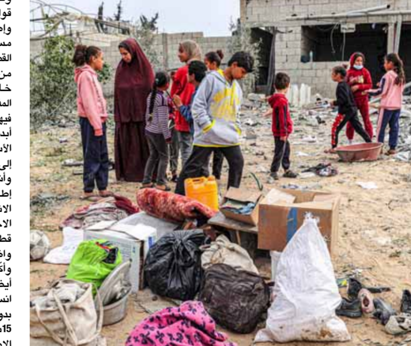
عائلة فلسطينية أمام أنقاض منزلها بعد القصف الإسرائيلي على جنوب قطاع غزة

قالت أن البدائل ليست في مصلحة الفلسطينيين فقط بل ليست في مصلحة إسرائيل ومكانتها في العالم، وأضافت في بيان لها: «سعيها للاجتماع بالوفد الإسرائيلي لتطرح عليه أفكاراً بديلة عن عملية عسكرية كبرى برفح، ومسار المفاوضات هو الذي سيؤدي إلى هدنة وإطلاق