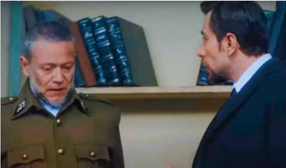
ليث المفتي في مسلسل «بيت أهلي»