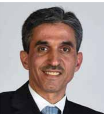
الدكتور محمد خير العكام

ويحلب ب٦١٨٨٨ بوابة، إضافة لتخصيص القططرة والبلد والرقة ب٦٦٤٤ بوابة لكل محافظة، ومحافظه درعا ب٣٣٢٦ بوابة إنترنت، كما خصصت محافظة حمص ب١٤١٤٤ بوابة، وحماة ب١٩٠٧٢ بوابة، إضافة لتخصيص محافظة طرطوس ب٤٩٩٢ بوابة، واللاذقية ب٩٩٨٤ بوابة، ودير الزور ب٣٠٩١٢ بوابة إنترنت. ونوهت الوزارة بأن السورية للاتصالات تخطط لتوريد ١٦٦٤٠٠ بوابة إضافية خلال الربع الأخير من العام الجاري؛ وتأكيداً لحرصها على تأمين خدمات الإنترنت للمواطنين بشكل مدروس دون التأثير بشكل سلبي على جودة الإنترنت، ستقوم الشركة هذا العام بتوسيع البوابة الدولية من ٨٠٠ فيغيا إلى ١,٦ تيرابت/ ثانية، وستوسع ١ تيرابا في الاستثمار كمرحلة أولى وعند انتهاء تركيب التجهيزات اللازمة لتوسيع البوابة.