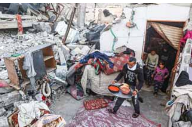
أسرة فلسطينية تعيش على أنقاض منزلها المدمر نتيجة قصف الاحتلال الإسرائيلي على غزة

على مشروع قرار، كان مقرراً أمس، أعده أعضاء غير دائمين، يدعو إلى وقف إطلاق النار في قطاع غزة خلال شهر رمضان المبارك، إلى غد الإثنين. وكشفت مصادر دبلوماسية لوكالة «فرانس برس»، أن هذا الإجراء تقرّر للسماع بإجراء مزيد من المناقشات بشأن مشروع القرار الجديد، هذا، الذي أعده عدد من الأعضاء غير الدائمين في المجلس، هم: الجزائر، مالطا، موريتانيا، غويانا، سلوفينيا، سيراليون، سويسرا والإكوادور. وبحسب مشروع القرار الجديد على وقف نار إنساني فوري في شهر رمضان بقود إلى وقف دائم للنار، وإزالة كل العقبات أمام المساعدات الإنسانية.