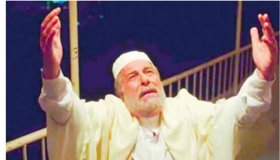
تيسير ابريس في مسلسل «ولاد بديعة»