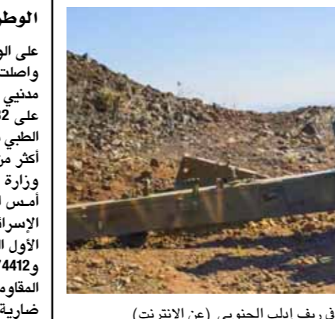
عناصر للجيش العربي السوري يستهدفون الإرهابيين في ريف إدلب الجنوبي

تابع ل«النصرة» غرب البلدة أدى إلى اندلاع النيران فيه وتدمير كل محتوياته، إضافة إلى مقتل 3 حراس من الإرهابيين نقلتهم سيارة إسعاف إلى أحد مشافي مدينة أربحا القريبة من مكان وقوع الحادث. وفي البادية الشرقية، خاضت الوحدات المشتركة من الجيش والقوات الرديفة أمس، اشتباكات ضارية مع خلايا من تنظيم داعش الإرهابي الذي رفع مؤخراً وتيرة هجماته المباشرة على نقاط لها بعدة قطاعات من البادية، إضافة لاستهدافه ورشات جمع الكمامة المدنية. وأوضح مصدر ميداني ل«الوطن» أن الاشتباكات تركزت في قطاعات بادية تدمر بريف حمص الشرقي، وفي منطقة الرصافة بادية الرقة وفي جبل البشري بادية الزور، مشيراً إلى أن الدواعش تكبدوا خسائر بالأفراد والعتاد، فيما ارتقى عدة عناصر من الجيش