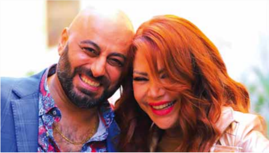
غزوان الصلبي في مسلسل «ولاد بديعة»