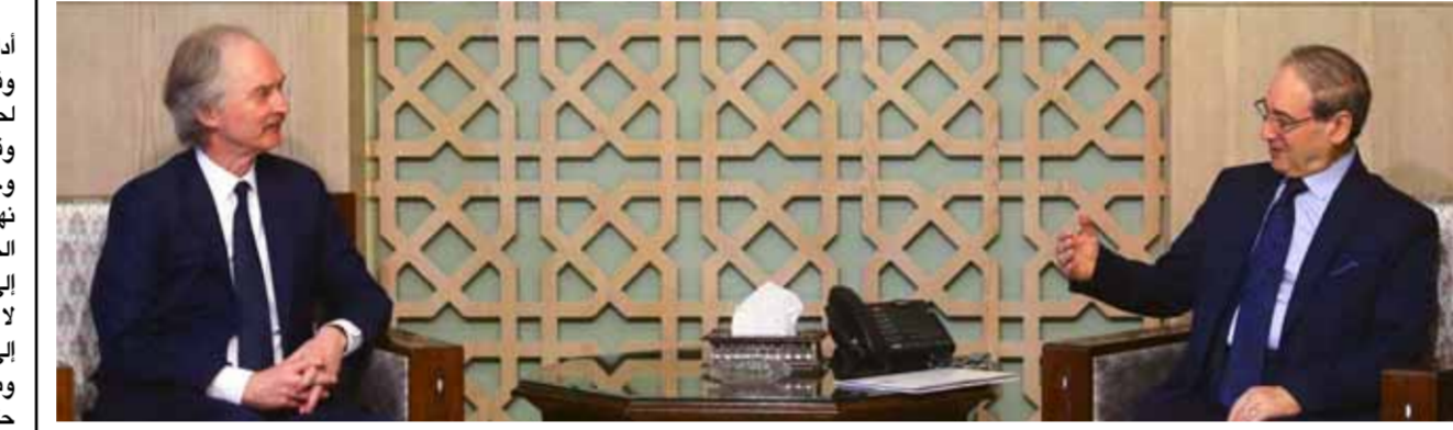
وزير الخارجية والمغتربين فيصل المقداد خلال استقباله أمس المبعوث الخاص للأمم المتحدة إلى سورية غير بيدرسون