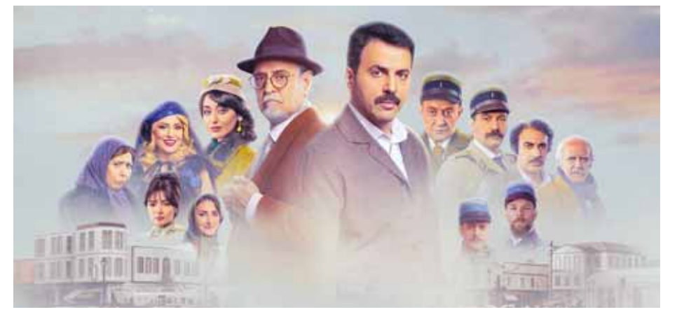
من مسلسل «تاج»