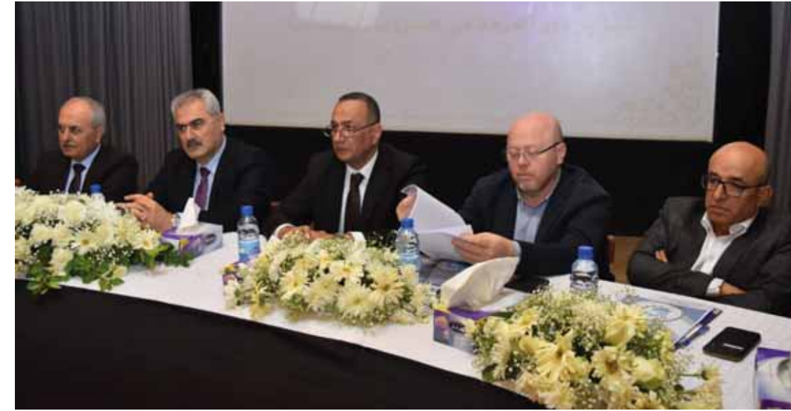
مادة الإسمنت بموجب الهوية الشخصية، وفي معرض رده على التساؤلات، لفت وزير التجارة الداخلية وحماية المستهلك