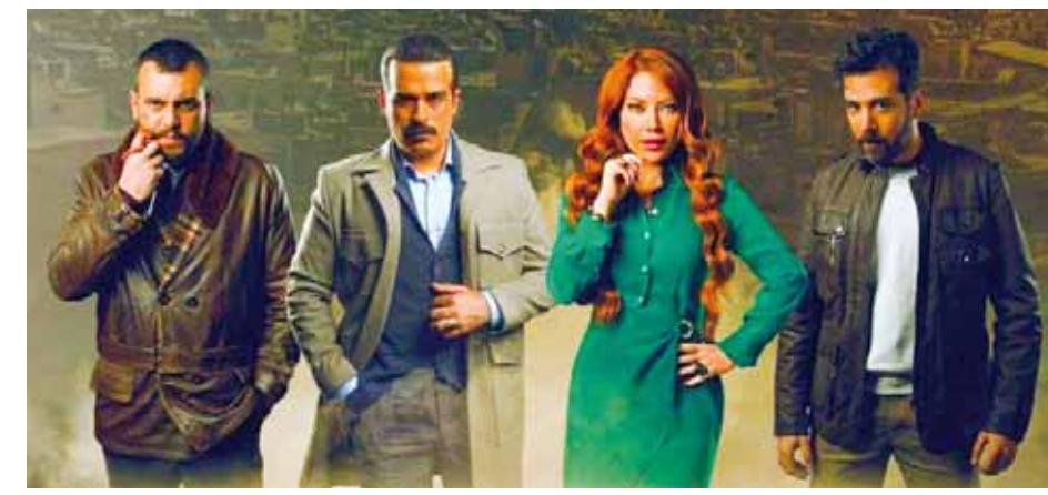
من مسلسل «ولاد بديعة»

انتهت معظم الأعمال الدرامية بانتهاه شهر رمضان المبارك، وقد شهد بعضها حالة من التزلزل على صعيد النص والإخراج وبالتالي تاه العمل وتشتت أفكاره وتلاشت خطوطه الدرامية. وقد شهدت انطلاق بعض الأعمال انبهاراً جماهيرياً كبيراً وجذبت حواراتها المشاهد وأسكت بيده للبقاء أمام الشاشة منتظراً الحدث تلو الآخر، ولكن سرعان ما تلاشى هذا الانبهار وتساقت بتقدم الحلقات، ولم يستطع تفوق أبطال العمل في أدائهم إنقاذ النص من الانتقادات للقصّة التي فقدت بريقها، وقد أخذت بعض الأعمال التي عرضت منحي جيداً بعد انتصاف الحلقات وشهدت خطوطاً درامية جديدة وفي الوقت ذاته راحت شخصيات تغادر. كما أن بعض الأعمال شهدت تحطيماً في بداية حلقاتها وعرضت بطريقة غير مترابطة وغير منسجمة ولكن بتقدم الحلقات استطاع مخرجها أن يجمع خطوطها وينسج منها حكاية درامية مشوقة. في هذه المادة سنسرد نهايات بعض الأعمال الدرامية العروضة في الموسم الرمضاني وأهم الرسائل التي حملتها.