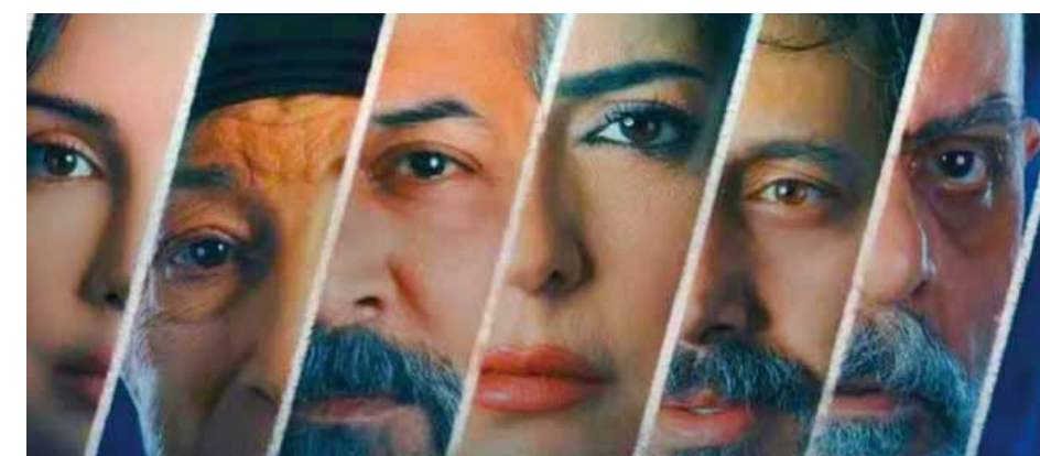
من مسلسل «أعشى عينيك»

وقد اكتفى صناع «وصايا الصبار» بسبع عشرة حلقة بعيداً عن الحشو الزائد الذي لا يقدم جديداً وعن الاستعراض الذي لا يجدي، وبرغم أن العمل يحمل الكثير من الجرائم إلا أنه أيضاً قدم بعض العبر والرسائل التي مفادها أنه لا شيء إلا يمكن أن يمرر الحكاية بطريقة منطقية مقاربة زمنياً وواقعية؟