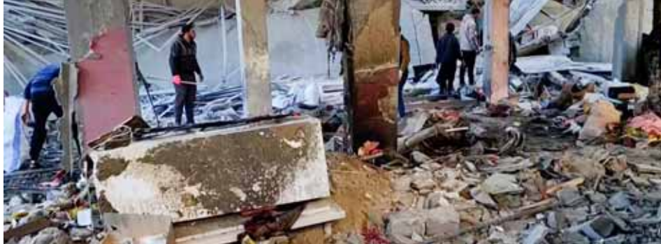
الاحتلال يرتكب مجازر جديدة في غزة