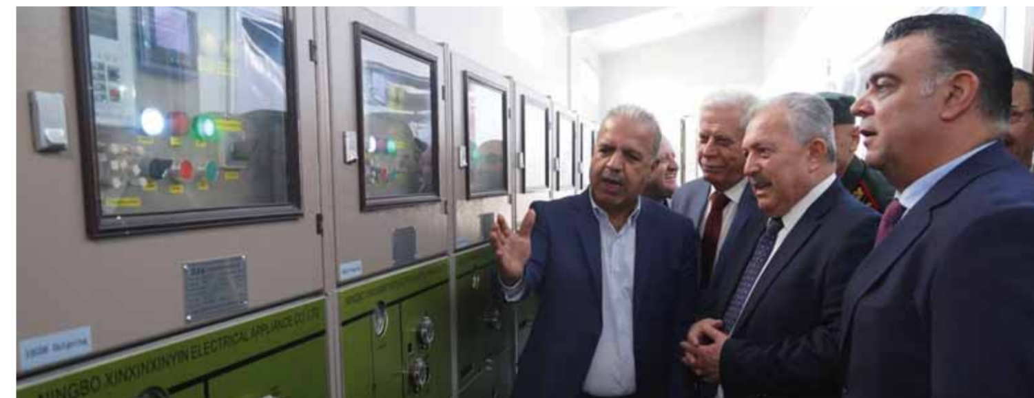
محمد راكان مصطفى

وزير الكهرباء: التأهيل تم بأيدٍ وخبرات وطنية وحقق وفراً بأكثر من ٧ مليارات ليرة