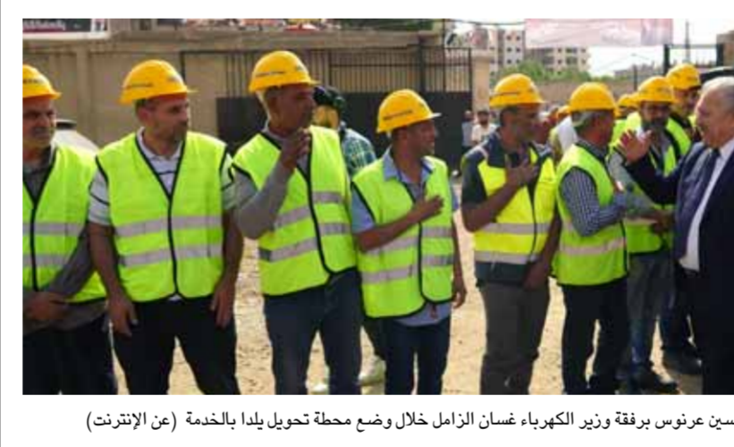
رئيس مجلس الوزراء حسين عرونس برفقة وزير الكهرباء غسان الزامل خلال وضع محطة تحويل يلبدا بالخدمة

سورية وحرص الحكومة على عودة كل الهامش تكريمه بعد تأمين الخدمات الأهالي إلى منازلهم بعد تأمين الكهرباء الأساسية لهم، رغم أن ما دمته الأرباب من بنية تحتية وخدمات كبير جداً. من جهة قال وزير الكهرباء غسان الزامل لـ«الوطن»: إن مشكلة تردى الكهرباء سببه نقص توريدات المشتقات النفطية التي من المتوقع أن تنتهي منتصف الشهر الجاري مع بدء وصول التورينات، وسنعود تنفيذها، معتبراً أن سلسلة المشروعات التي يتم وضعها بالخدمة في مختلف القطاعات كالكهرباء والزربية والصحة والاقتصاد والحصر الجائر والنظم، بدأت