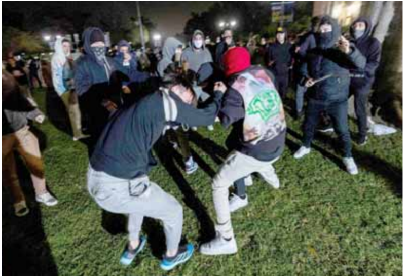
صدامات بين طلاب جامعة كاليفورنيا المؤيدين للفلسطينيين وقوى الأمن

وأعيد إعمار القطاع، فيما تتضمن المرحلة الثانية وضع خطة لإصلاح أجهزة السلطة الفلسطينية، أما المرحلة الثالثة حسب الخطة العربية فتشمل إطلاق مفاوضات بخصوص قضايا الوضع النهائي مثل القدس والحدود واللجئين والمياه، لتنتهي إلى المرحلة الرابعة والتي يتم فيها الإعلان عن استقلال فلسطين وبعدها التطبيع بين إسرائيل والدول العربية. على العقب الآخر، تواصلت تهديدات العدو بقرب شن عملية عسكرية واجتياح مدينة رفح، وهو العنوان الذي شكل محور محادثات وزير الخارجية الأميركي أنتوني بلينكن في تل أبيب أمس، حيث أشار في حديث للصحفيين بعد محادثات مع رئيس وزراء العدو بنيامين نتانياهو ومسؤولين آخرين في كيان الاحتلال، إلى أنه أبلغ القادة الإسرائيليين بوضوح معارضة الولايات المتحدة لهجوم بري واسع على مدينة رفح في جنوب قطاع غزة، مشيراً إلى أنه اقترح «حلولاً أفضل» للتعامل مع حماس، على حد تعبيره، وقال: «هناك حلول أخرى، وفي رأينا حلول أفضل، للتعامل مع التحدي الحقيقي المستمر الذي تمثلته حماس والذي لا يتطلب عملية عسكرية كبيرة» في رفح. بالتزامن قال رئيس أركان جيش الاحتلال هيرتسي هاليفي خلال جولة لتقييم الوضع على الحدود اللبنانية، إن «إسرائيل تجهز لهجوم في الجبهة الشمالية». وقال المتحدث باسم جيش العدو: إن رئيس الأركان أجرى أسس الأربعة جولة وتقيماً للوضع على الحدود اللبنانية مع قائد القيادة الشمالية اللواء أوري غوردن، وقائد الفرقة 146 وقادة آخرين.