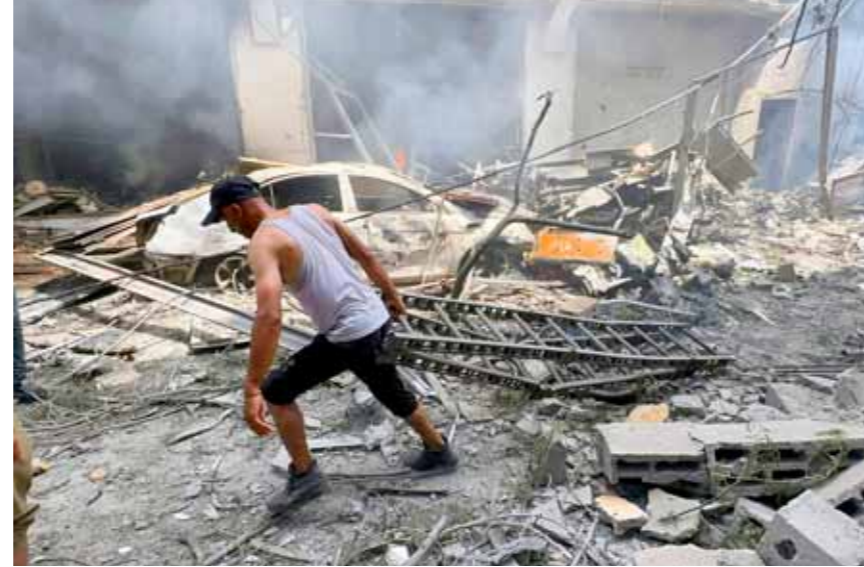
فلسطينيون يبحثون عن ناجين بين الركام بعد القصف الإسرائيلي على وسط قطاع غزة (عن الانترنت)

التي يرتكبتها الاحتلال الإسرائيلي بحق الشعب الفلسطيني في قطاع غزة، ومحاسبة حكومة الاحتلال الفاشية ومرتكبي هذه الجرائم ومساءلتهم أمام المحاكم الدولية، مشيرة إلى أن الولايات المتحدة الأميركية مشاركة في هذه الأعمال الإجرامية، وتحتمل مسؤولية ما يرتكب من مجازر مروعة بحق اللاجئين، وفق مبادرة السلام العربية وقرارات الشرعية وأضافته الوزارة: «لم تعد الكلمات قادرة على وصف الجرائم الصهيوني الذي رفضته محكمة العدل الدولية والمحكمة الجنائية الدولية، وأصبحت دعوة المجتمع الدولي والأمم المتحدة إلى التحرك عاجيا ودوليا واسعة، وأكثت دمشق على لسان خارجيتها وجوب وقف المنذبة والإبادة الجماعية لهذه الكارثة الإنسانية أمرا حتميا».