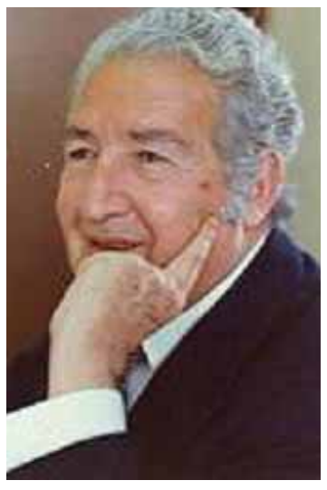
إحسان عبد القدوس