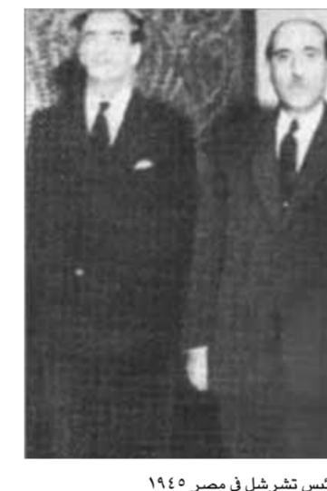
اللقاء الوحيد للرئيس القوتلي مع الرئيس تشرشل في مصر ١٩٤٥

في هذا المدخل المأخوذ من الوثائق التاريخية يظهر الكاتب د. مبيض العلاقة بين سورية، وهذا المدخل بين العلاقة الشخصية والرأي الشخصي له، والقارئ يجب أن يقرأ أمام الردين من تشرشل، فهو لا يعطي الجلاء قيمة، ولا يشارك فيه من خلال رؤيته الاستعمارية الاستعلائية، وفيها لا يشارك الشعوب المتحررة فرحة حريتها، ولا يسجل على نفسه