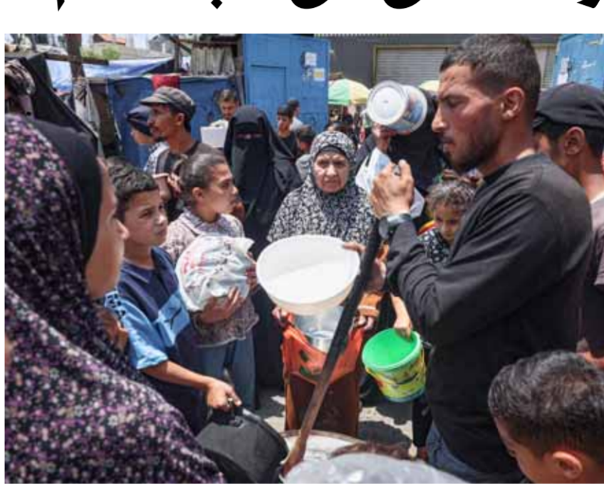
فلسطينيون بانتظار وجبة طعام في مخيم البريج في قطاع غزة المحاصر

يوماً لإعادة الرهائن، ولكن ليس وقف الحرب». وأضاف: «لن أكون مستعداً لوقف إطلاق النار، رغم ما قاله الرئيس بايدن، ولن تنتهي الحرب من دون تحقيق الأهداف كافة، ولن نخلى عن النصر المطلق». الرد الأميركي على نتباهو لم يتأخر واعتبرت الخارجية الأميركية في بيان لها أن الصراع الذي لا نهاية له في غزة سيعا إلى تحقيق فكرة النصر الكامل لن يجعل إسرائيل أكثر أماناً، وقالت: «إن الاعتماد على الحلول العسكرية فقط ليس كافياً»، مشددة على ضرورة اتباع مسار دبلوماسي لحل الأزمة. من جهتها نقلت صحيفة «وول ستريت جورنال» الأميركية، أن مسؤولي «حماس» قالوا للوسطاء أنهم لم يروا اقتراحاً إسرائيلياً يتطابق مع الصيغة المحتملة، التي نقلها الرئيس الأميركي، جو بايدن». ووصف مسؤولون من حماس بنود الصيغة، التي نقلها بايدن، بـ«الجادة»، إلا أن الحركة تريد اقتراحاً مفصلاً ومكتوباً، يعكس ما تحدث عنه بايدن، ويتضمن وقفاً شاملاً ودائماً لإطلاق النار، وفقاً للوسطاء العرب. وأضافوا: إن الاقتراح الإسرائيلي الأخير، الذي تفوه، وصف فترة من «الهدوء المستدام»، بعبارة غامضة فقط. وأشارت الصحيفة إلى أن قائد حركة حماس في قطاع غزة، يحيى السنوار، ليس في عجلة من أمره لبدء صيغة وقف إطلاق نار وتبادل الأسرى، مضيفة: إن استمرار الحرب يجز إسرائيل إلى مستنقع يحولها إلى منبوذة دولياً، كما أنه يعنش القضية الفلسطينية.