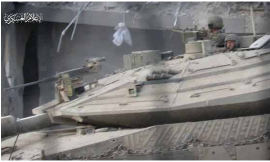
مشاهد من استهداف دبابة إسرائيلية من نوع «ميركافا ٤» خلال التوغّل شرقي مخيم جباليا شمالي القطاع

إعلام إسرائيلية عن دوي صفارات الإنذار في «حوليت» و«صوفا»، في غلاف غزة.