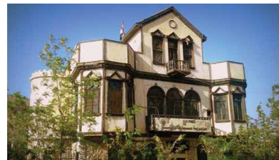
قصر كيوان الذي ظهر في مسلسل «هومي هون»

استطاعت مدينة حمص أن تخطف أنظار ممدوح حمادة وإخراج الليث حجوج وظهرها فيه باسم «أم الطنائس الفوقا»، حيث لفتت أنظار المشاهدين بسبب طبيعتها الخاصة والخلابة التي تجمع بين الجبل والبحر في مشهد ساحر جعلها فيما بعد مقصدا للكثير من السياح كما تواتر حولها المقالات والتقارير الصحفية