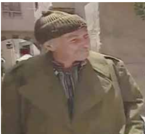
أبو الفضل في مسلسل «يايالي الصالحية»