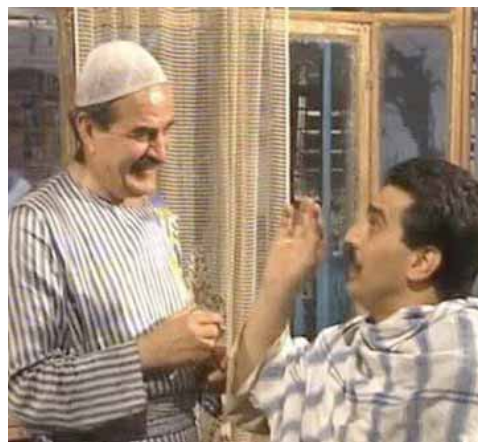
ديبو في مسلسل «أيام شامية»