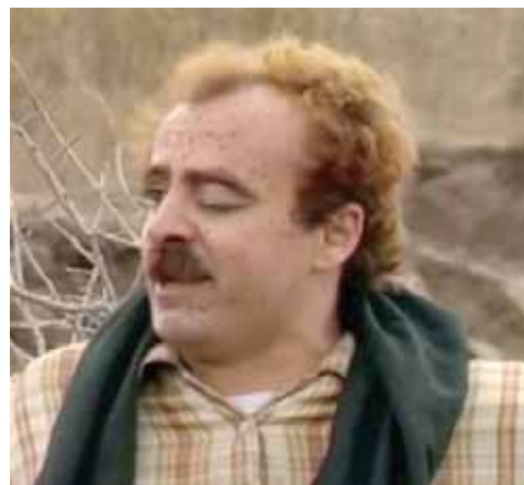
نوري المبيض في مسلسل «الدغري»