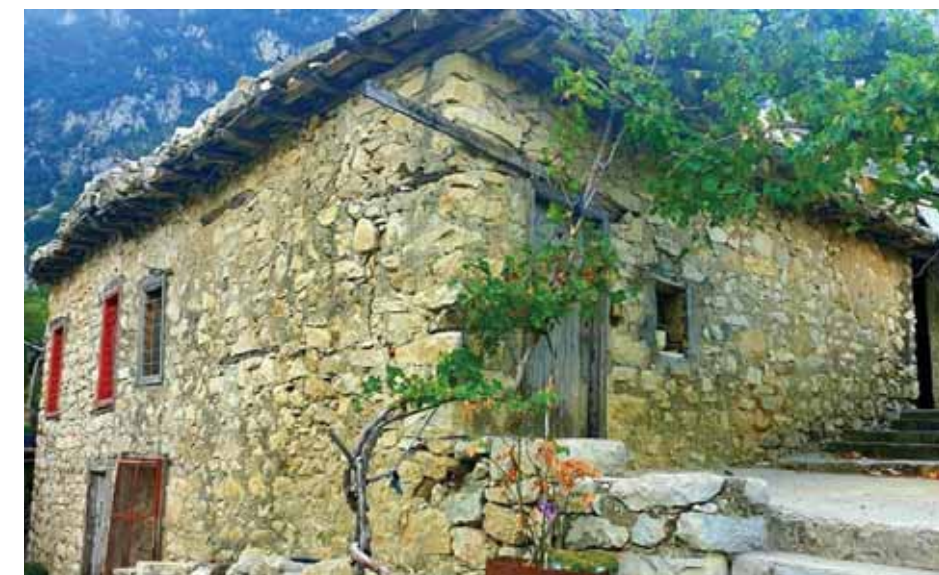
منزل سليم الذي ظهر في مسلسل «ضبعة ضايعة»