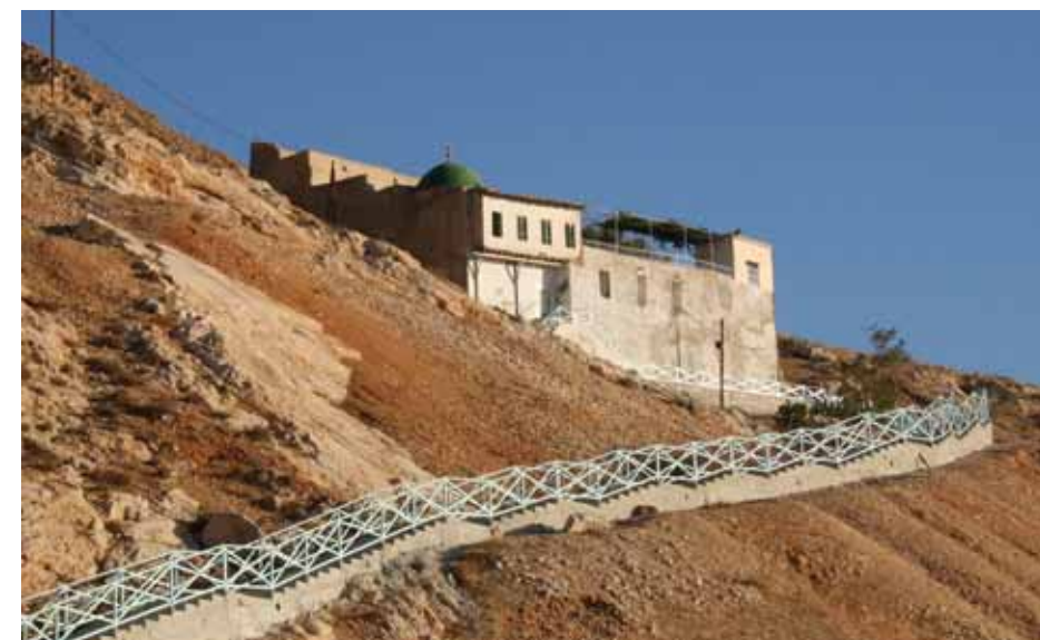
مقام الأربعين الذي ظهر في مسلسل «ولاد بديعة»