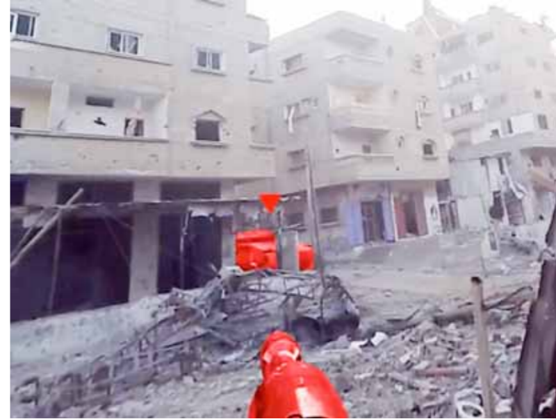
القسام تعلن مقتل وجرح أفراد قوة إسرائيلية في تفجير منزل برفح (عن الانترنيت)

وأضاف في مستهل جولته بالمنطقة من القاهرة أن حماس هي الوحيدة التي لم تقبل مقترحها، مشيراً إلى أن إسرائيل وافقت عليه. وبالتزامن مع الجولة الثامنة لوزير الخارجية الأميركي للمنطقة، تبني مجلس الأمن الدولي مشروع القرار الأميركي الذي يدعو لوقف إطلاق النار في غزة وتطبيق غير مشروع لصفقة. والمنوية الأميركية في مجلس الأمن ليندا توماس غريفيغلد دعت في كلمة لها خلال الجلسة حركة «حماس» لقبول الصفقة التي تؤدي لوقف إطلاق النار وقالت: إذا دامت القيادة المستحدثة التابع لـ«الفرقة 146» شرق مستوطنة «نهارييا» وجزءاً من مقر قيادي تابع لـ«فرقة الجولان 210 شاع»، عقب هجومين جويين شنهما على القرين بسرب من المسمرات الانتحاضية، تزامناً مع تدميره التجهيزات الفنية والتجسسية في موقع