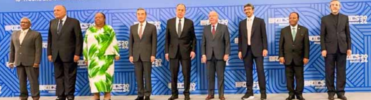
وزراء خارجية دول مجموعة «بريكس» في مدينة نييجني نوفغورود الروسية

وقال مدير مكتبها في تعليق له على صفحته الرسمية على موقع «X»: إن انتخابات البرلمان الأوروبي، التي حققت فيها القوى المعارضة للقيادة الحالية لفرنسا وألمانيا فوزاً ساحقاً، «ترسل واماكون إلى مزلة التاريخ». ووفقاً لمديرها، فإن انتخابات البرلمان الأوروبي «تعكس السياسات الاقتصادية وسياسات الهجرة الحمقاء وغير الكفاءة» التي ينتهجها شولتس وماكرون، اللذان يدعمان «سلطات بانديريا في أوكرانيا على حساب حياة مواطنيها». وحد نائب رئيس مجلس الأمن الروسي المستشار فولودين، اعتبر أن حزبي ماكرون وشولتس «خسرا بشكل بانس» في انتخابات البرلمان الأوروبي، مضيفاً: «سيكون من الصعب أن يستقبلوا ويتوقفوا عن الاستهزاء بمواطني دوليتهم»، رأى شاركته به رئيسة مجلس الاتحاد الروسي فالنتينا ماتفيينكو بالتأكيد أن الهزيمة الساحقة لماكرون وشولتس في الانتخابات، هي