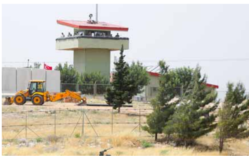
نقطة مراقبة لجيش الاحتلال التركي في ريف ادلب

حوار أو تفاوض مع الجانب التركي، وهي تعتبر أن إعلان أنقرة بشكل واضح نيتها الانسحاب من أراضيها لا يمكن وصفه بالشروط لأن استمرار معروفاً بأن بغداد تلعب دوراً واضحاً في هذا الإطار بدعم من المملكة العربية السعودية وروسيا والصين وإيران، وموافقة ضمنية أميركية، وهي تسعى لإطلاق قريب لهذه «العملية»، حتى وإن كان بداية على المستوى الفني تمهيدا لعقد لقاءات على مستوى أعلى في حال كانت شروط حصول مثل هذه اللقاءات محققة.