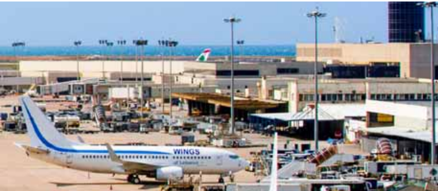
لقطة عامة لمطار بيروت الدولي

وقد يعني هذا بشكل مباشر تورط من يقوم بتزويد إسرائيل بالسلاح، وأن أولئك الذين يقومون بتحويل حربيها على فلسطين والدفاع عن مزارعها في المنظمات الدولية شركاء في هذه الجريمة... وجدت الخارجية مطالبة سورية لمن تبقى من مجتمع دولي بالعمل على وقف هذه الإبادات البشرية والتصدي لجرائم جيش الاحتلال الإسرائيلي وقيادته المجرمة والمعقدة والفاشية التي تربي عليها، وإعلان هذا الجيش جيشاً مجرماً ومحاسبة حكومته وقيادته بموجب القانون الدولي على ما اقتره من جرائم بحق الفلسطينيين والإنسانية. وأمس رد وزير الأشغال العامة والنقل اللبناني على حمية على مزارع صحيفة «التلغراف» البريطانية، وقال: إن هذا الاقتباس عار عن الصحة، والاتحاد لم يعلق على الوضع في مطار بيروت، وهو لا يتدخل بالوضع السياسي أو الأمني في لبنان.