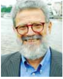
من دفتر الوطن

الأميركي جون بليك: «نحن الآن في زمن تحتل فيه قصص إخفاق أميركا الخيال والثقافة الشعبية، إنها النقيض من قصص الأمل، التي اعتادها الأميركيون، من أجل توحيدهم في الأوقات الصعبة».