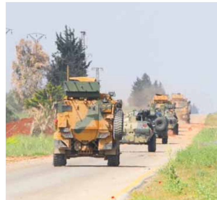
دورية روسية - تركية مشتركة على طريق «M4»

وتنظيماته من جهة أخرى، مشدداً على أن تلك المبادرات تعكس إرادة الدول المعنية بها لإحلال الاستقرار في سورية والمنطقة عموماً. وشدد على أن سورية تعاملت دائماً بشكل إيجابي وبناء مع كل المبادرات ذات الصلة، لافتاً إلى أن نجاح وإشمار أي مبادرة ينطلق من احترام سيادة الدول واستقرارها. وشهدت الأيام الفائتة سباقاً متسارعاً في التصريحات التركية تجاه التقارب مع سورية سواء من قبل الحكومة أم المعارضة، حيث قال رئيس حزب الشعب الجمهوري المعارض الرئيسي في تركيا أوزغور أوزال: إنه يقوم بمحاولات لترتيب لقاء مع الرئيس الأسد. وأضاف «نقوم من جانبنا بما يسمى بالدبلوماسية غير الرسمية مع سورية، أفكر في الذهاب والاجتماع مع الرئيس الأسد في الأيام المقبلة إذا تمكنا من ترتيب ذلك. الحديث لا يدور عن لقاء بعد فترة طويلة، بل عن إمكانية عقد مثل هذا الاجتماع خلال هذا الصيف». وتمتاً مع هذه التصريحات جرى افتتاح تجريبي لمعبر «أبو الزين» في مدينة الباب شمال شرق حلب، وذلك في ظل تواتر أنباء عن احتمال وضع طريق حلب- اللاذقية والمعروف بطريق «M4» في الخدمة، وفتح طريق غازي عنتاب أمام حركة الترانزيت من مدينة إزاز عند الحدود التركية شمال حلب إلى مبرن نصيب عند الحدود الأردنية، ومنها إلى دول الخليج العربي، وهو الشريان الاقتصادي لتركيا الذي تريد من خلاله إنقاذ اقتصادها المتهاك والوصول برأى إلى دول الخليج.