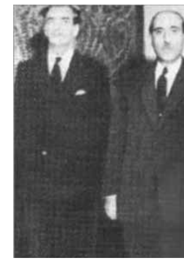
اللقاء الوحيد للرئيس القوتلي مع الرئيس تشرشل في مصر ١٩٤٥

ويذكر موقف تشرشل من الإسلام عندما عين في السودان: «ما أفتق لعنات الحمودية التي تجمع هذا السياسي البريطاني بسورية، وهذا التدخل بين العلاقة الشخصية والرأي الشخصي له، والقارئ يجب أن يقرأ أمام الردين من تشرشل، فهو لا يعطي الجلاء قيمة، ولا يشارك فيه من خلال رؤيته الاستعمارية الاستعلائية، وفيها لا يشارك الشعوب المتحررة فرحة حريتها، ولا يسجل على نفسه