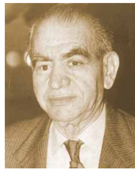
عبد السلام العجيلي