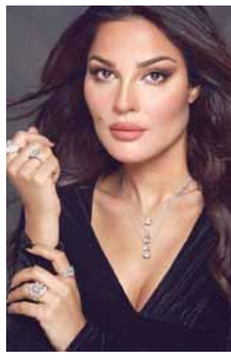
نادين نسيب نجيم

دشتت الفنانة المصرية شيرين عبد الوهاب حسابها الجديد على منصة «اكس»، بعد أن ألق حاسبها القديم بعد مشاكل عدة كانت قد تعرضت لها مع الأشخاص القاشين على الحساب. وردت عليه: «انقلت من الصنف كله».